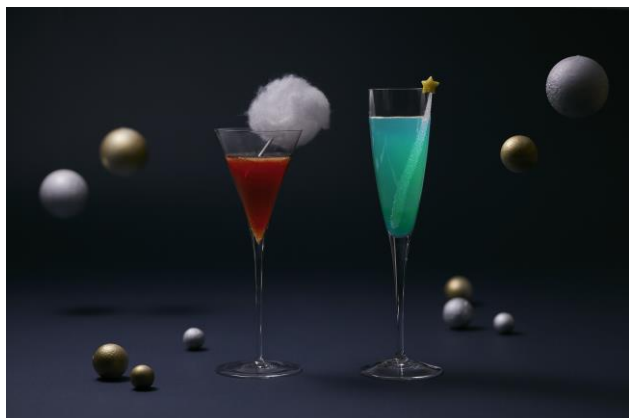
宇宙や星空をイメージした2種類のカクテル