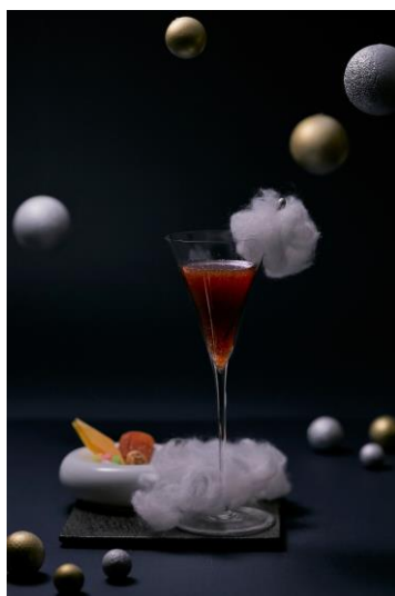
プラネットギフト