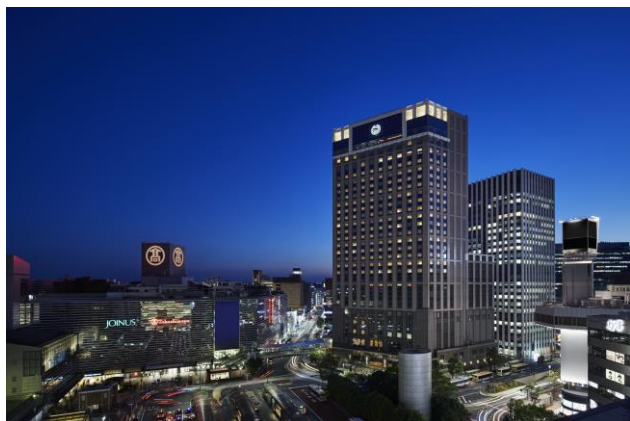
横浜駅から徒歩1分 横浜ベイシェラトン ホテル

非日常と癒しを同時に体験いただける、プラネタリウムとホテルステイが一体となった宿泊プラン。特別な人との大切な記念日や女子会、夏休みの横浜旅行にも最適なステイをご提案いたします。