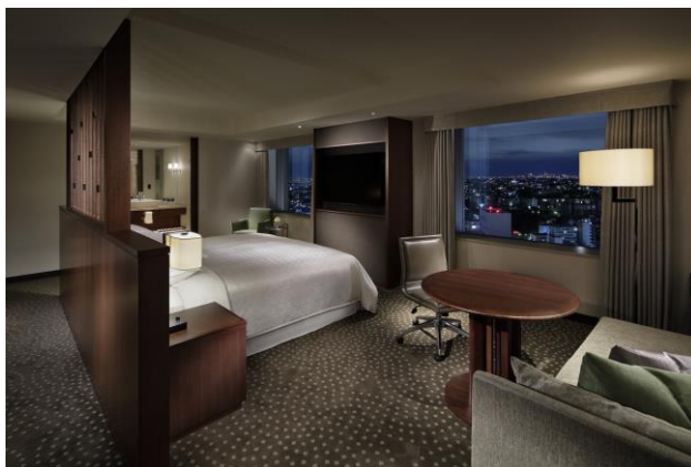
広々とした客室でリラックスした贅沢な夜を