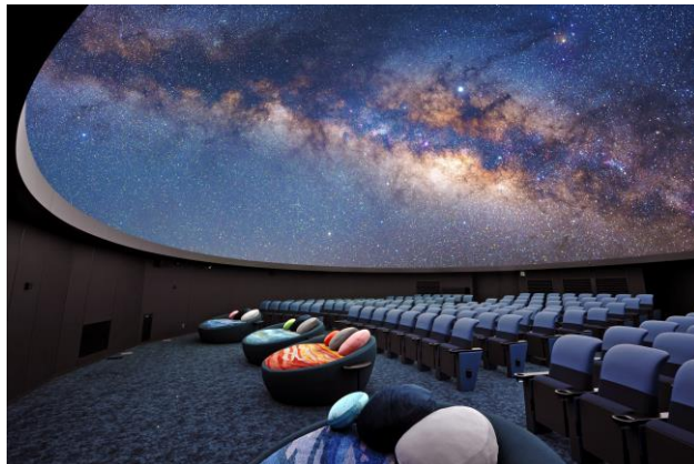
LED プラネタリウム「プラネタリア YOKOHAMA」