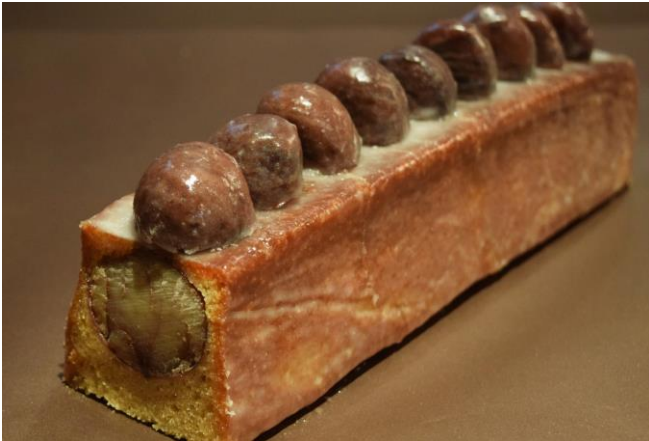
大粒の「熊本県やまえ 利平栗」が丸ごと10個入り

ケーキ中身には大粒の「熊本県やまえ 利平栗」が丸ごと10個入り、更にトッピングにもハーフポーションの同利平栗が9個デコレーションされた豪華な焼菓子です。