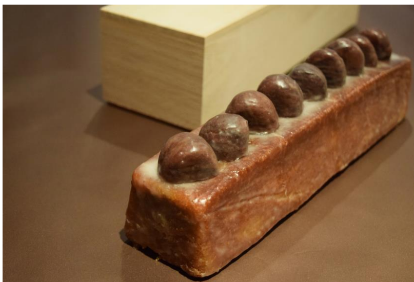
極上和栗のパウンドケーキ「令和 道(れいわのみち)」

お祝いムードを盛り上げると共に、縁起ものとしてもご贈答用にも相応しい、至福の味わいを心行くまでお楽しみください。