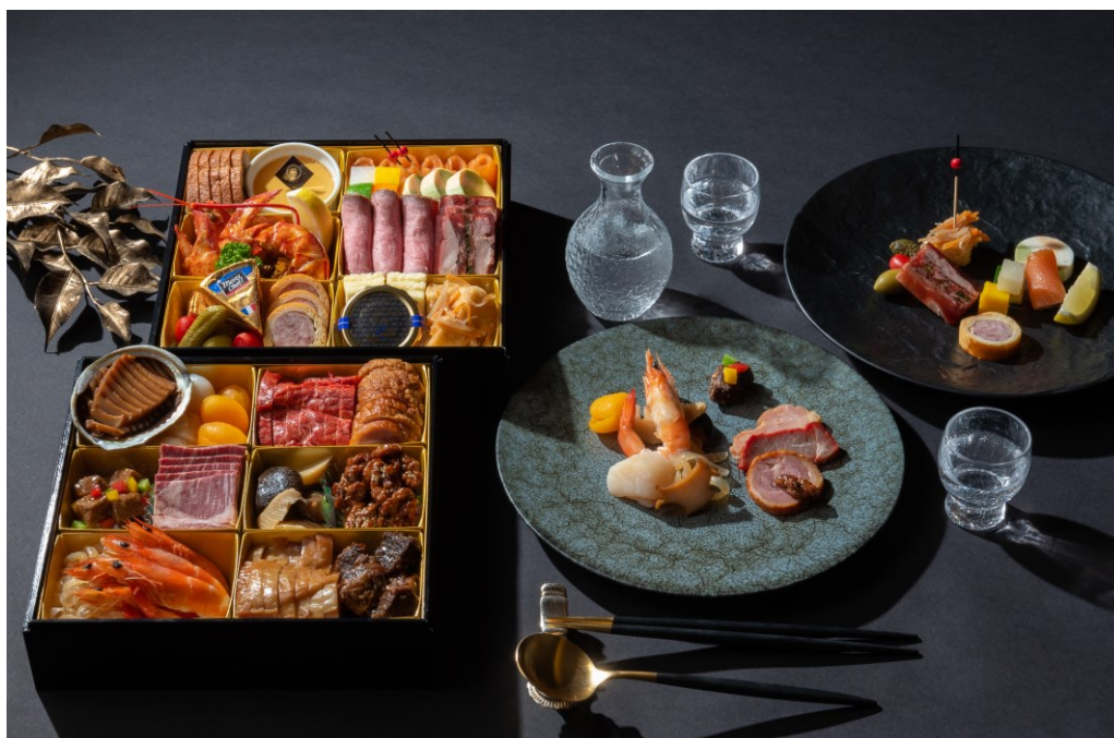
晴れやかな新年に華を添える味わい深いおせち

人と人の距離をより一層大切に考える今、新たな年のはじまりに、“大切な人と食卓を囲む”皆さまの幸せとご健康を心より願い、まごころを込めてお作りいたします。ご自宅用に、また遠く離れた方へ新年のご挨拶を兼ねた贈り物として、皆さまのご指定の場所へご配送も承ります。