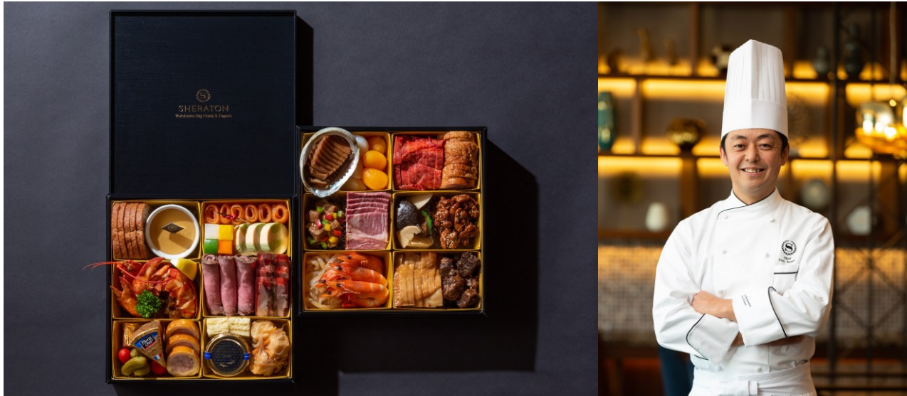
洋・中おせち二段重

更に、横浜ベイシェラトン ホテル&タワーズではSDGsへの取り組みにも力を入れており、紙製重箱を起用、“プラスチックフリー”を推進し、お客様とともに人と環境にやさしいホテルを目指してまいります。