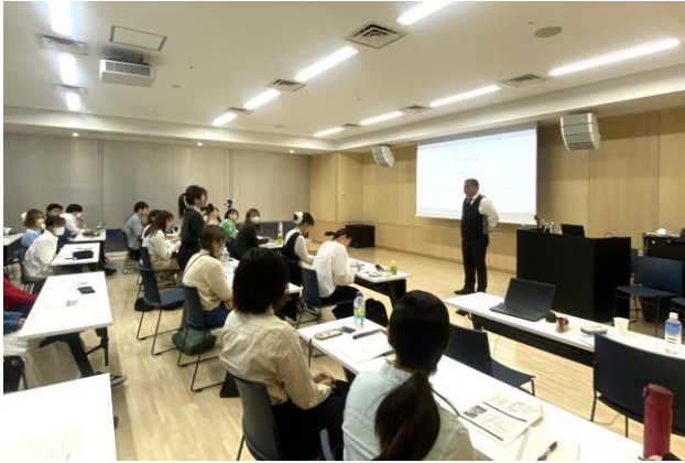
プロジェクトのきっかけとなった 石原総支配人の講義には多数の学生が参加