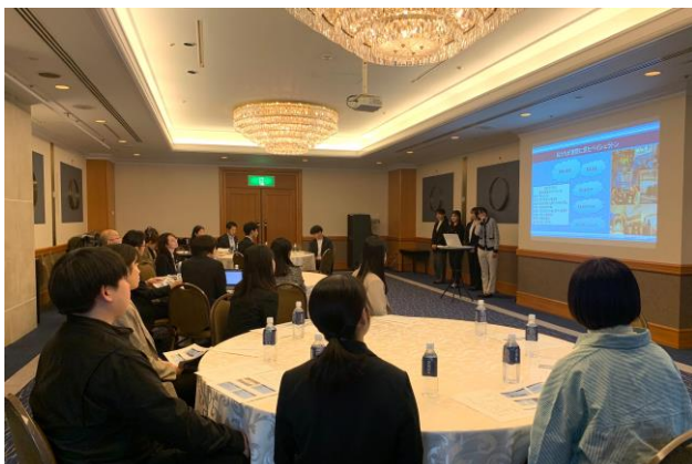
ホテルにて最終プレゼンテーションの様子