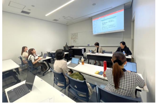
神奈川大学にてホテルスタッフと学生の打ち合わせ