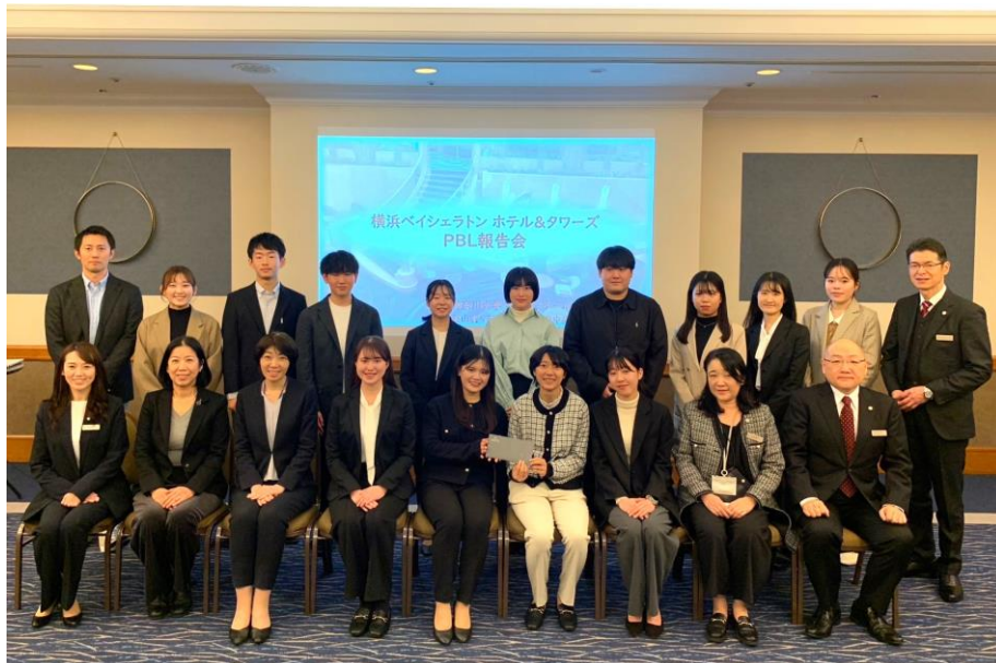
横浜ベイシェラトンホテルで行われた最終プレゼンテーションには、神奈川大学のゼミのメンバーや、社会連携部の方も参加

「大人になってから“ありがとう”という感謝の機会が減ってしまった」ことに着目し、春先の卒業シーズンや新生活を迎えるタイミングに合わせ、「この機会に大切な人へ感謝を伝えてみませんか」という学生目線のメッセージを込め、離れて暮らす両親や大切な人にホテルでの特別な「時間」をプレゼントすることが主旨の本プラン。宿泊前には大切な人へ宛てたホテルからの招待状や、バーやラウンジで思い出を語らう特別なひとときをプロデュース、更には学生時代を過ごした横浜散策を親で楽しむ「人生の節目」に最適な宿泊プランです。