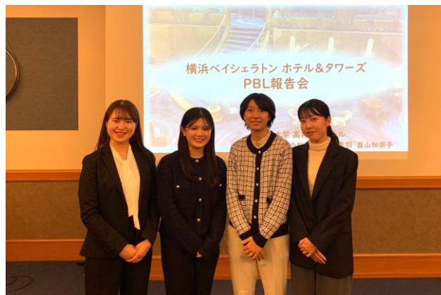
参加した高井ゼミナールの学生 4 名