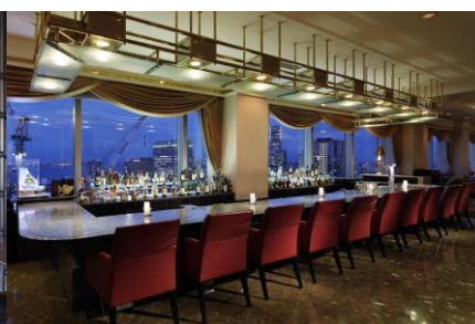
スカイラウンジ「ベイ・ビュー」にて夜景を眺めながら大人の時間