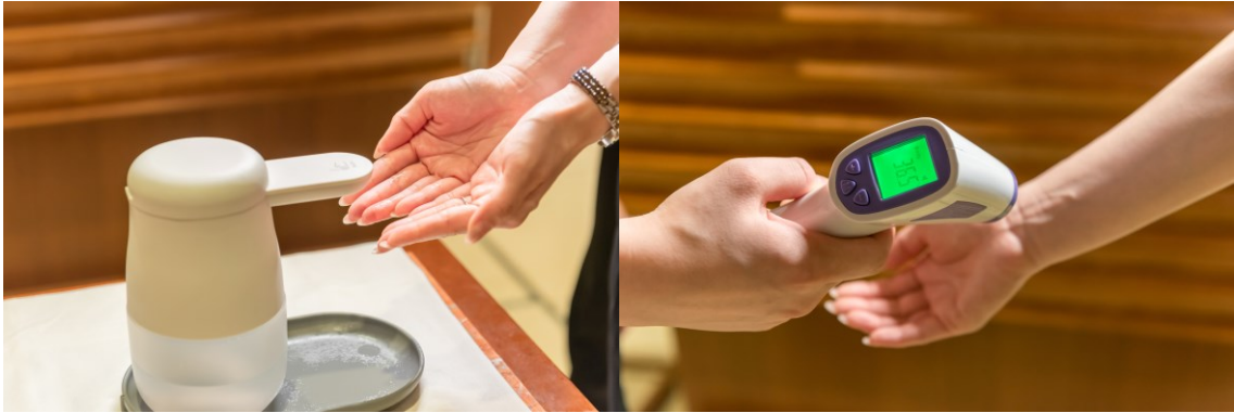
入店時の消毒・検温