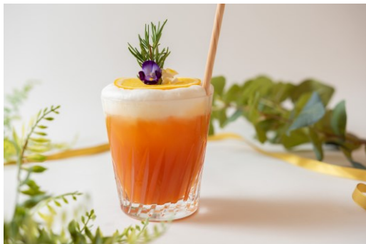
秋をイメージした新テイスト