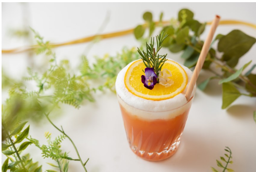
第2弾「ヒーリング フォレスト」

横浜ベイシェラトン ホテル&タワーズはこのプロジェクトに参画することにより、森林環境保全や天然資源の有効活用を推進し、またあらゆる人の活躍に貢献すること等横浜市が掲げるその主旨を広く多くの方々に伝えていきたいと考えております。