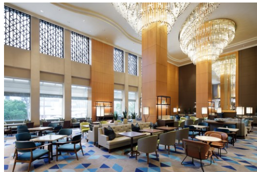
開放的なラウンジ「シーウインド」