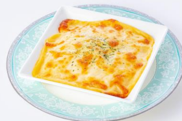
チキンドリア (1月2月)