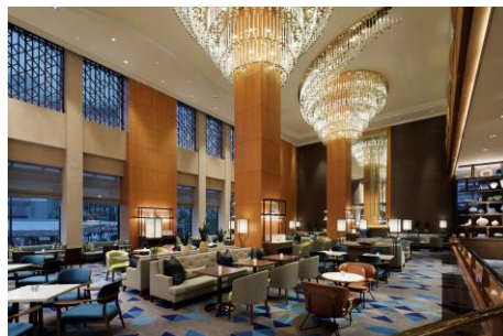
開放的で心地よいラウンジ「シーウインド」