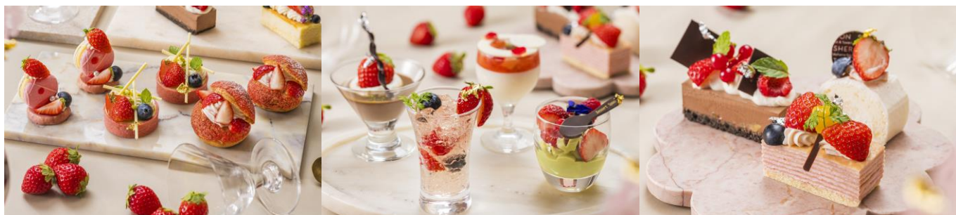
バニラ&チェリーマカロン (左) ショコラプリン (左上) 苺とヨーグルトムース (右上) ショコラムース (左下) 苺のロールケーキ (右上) 苺のタルト (中) 苺のシュークリーム (右) ロゼゼリー (左下) ピスタチオムース (右下) ミルクレープフレーズ (中)