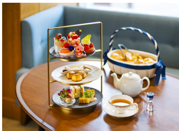
旬の苺を存分に味わえるアフタヌーンティー