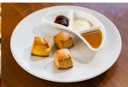
2種類のスコーンはお好きなだけ