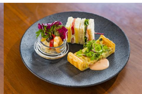
ホテルメイドのセイボリー