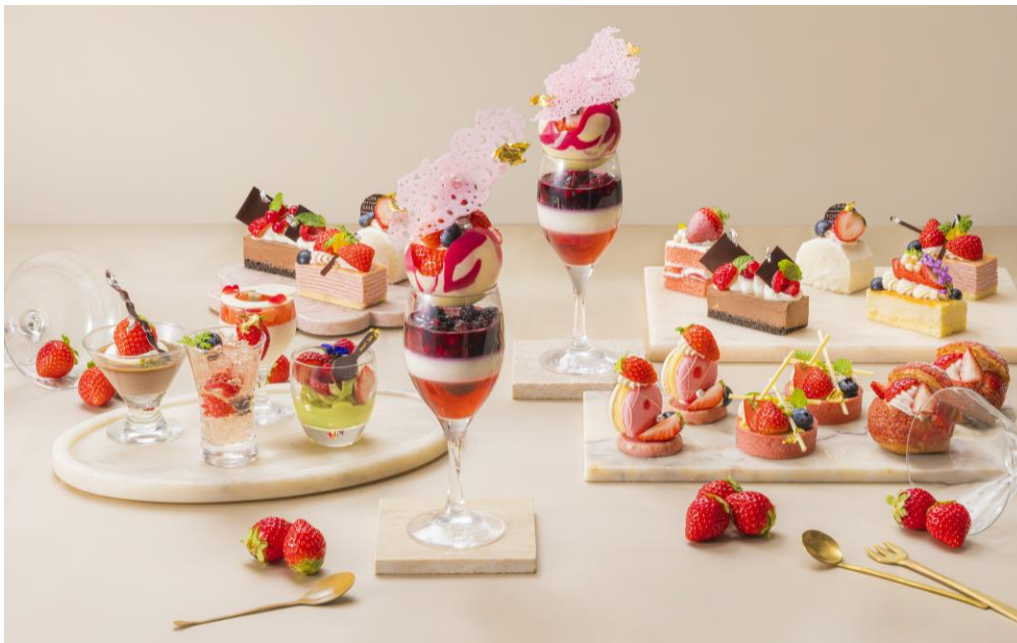
苺の魅力がぎゅっと詰まった、見た目も味も楽しめる人気のパフェやスイーツ

みずみずしい旬の苺をふんだんに使用した各種ストロベリースイーツや、ホテルならではの多彩なライトミールを心ゆくまでお楽しみいただける「Sweets Parade」～ストロベリー～。おすすめのスペシャルメニュー「苺とバラのパフェ」は、横浜市の花である「バラ」をテイストに使用したゼリーにバニラのブランマンジェ、鮮やかなベリーのソースを重ねた美しい三層仕立て。さらに、ストロベリーアイスを贅沢にトッピングし、繊細な餡細工と金箔で華やかに仕上げました。甘さと酸味が絶妙に絡み合う味のハーモニーをぜひご堪能下さい。また、素材にこだわった「ストロベリーショートケーキ」や、サクサクのシュー生地に苺とクリームが絶妙な味わいの「苺のシュークリーム」、ピスタチオと甘酸っぱい苺が見事に調和した「ピスタチオムース」、ストロベリークリームの層が美しい「ミルクレープフレーズ」など、全12種類の“苺尽くし”のスイーツをご用意しております。さらにフレッシュ苺をはじめ、スイーツと共に楽しめるライトミールには、寒い時期に嬉しいアツアツの「ビーフシチュー」やクリーミーな「チキンドリア」、ワインとの相性が抜群の各種チーズも取り揃えております。苺の甘い香りに包まれて、心華やくストロベリースイーツの数々を楽しみながら、開放的で心地よいラウンジ「シーウインド」で優雅なナイトタイムをお過ごしください。