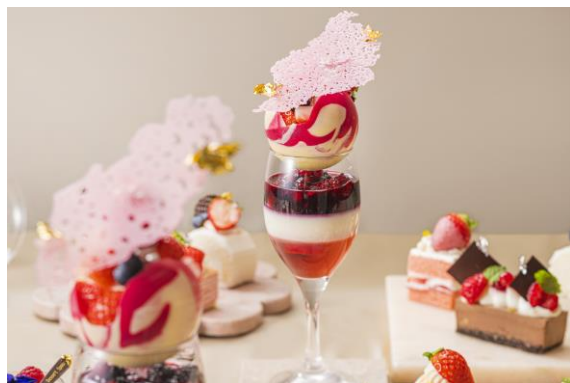
苺とバラのパフェ

ストロベリーショートケーキ／苺とヨーグルトムース ロゼゼリー／苺のシュークリーム ピスタチオムース／ミルクレープフレーズ ショコラプリン／苺のロールケーキ ベイクドチーズケーキ／ショコラムース バニラ&チェリーマカロン／苺のタルト