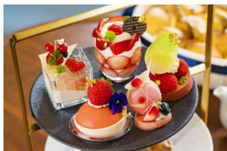
上段には5種類のスイーツ