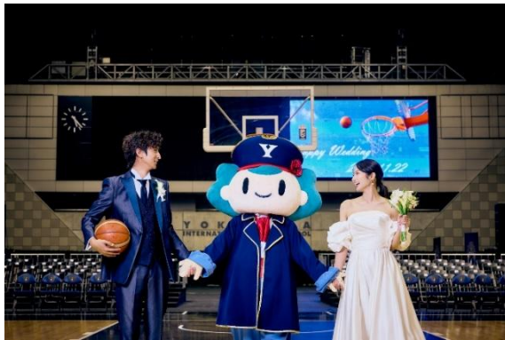
クラブマスコット「コルス（CORS）」 とのスリーショット