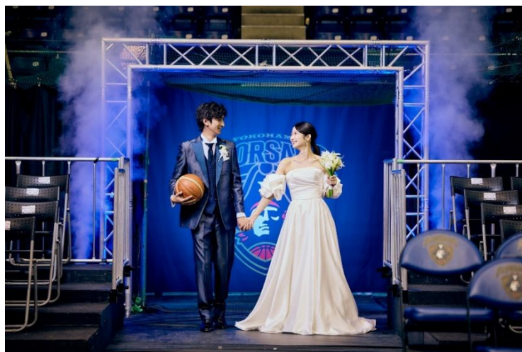
選手入場ゲートから颯爽と現れるおふたり

〒220-8501 神奈川県横浜市西区北幸1-3-23 T 045 411 1111 F 045 411 1343