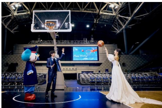
シュートシーンなど、動きのあるカットも