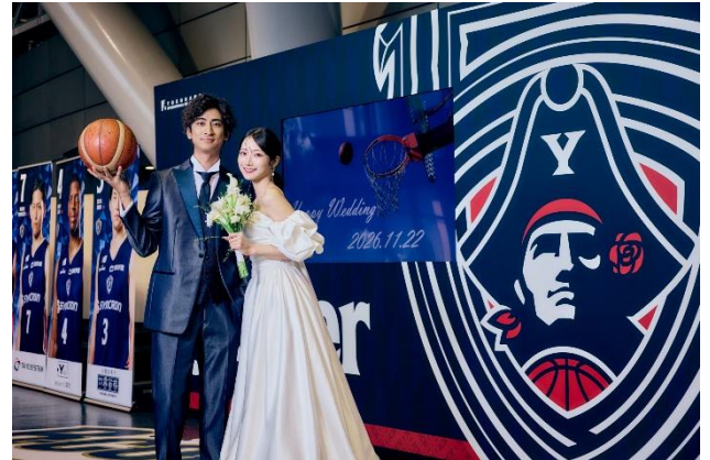
横浜ビー・コルセアーズ ファン・ブースターの 心を惹きつけるフォトウエディング