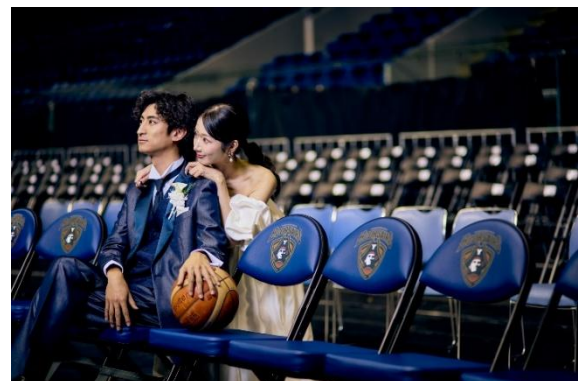
観客席でのワンシーン