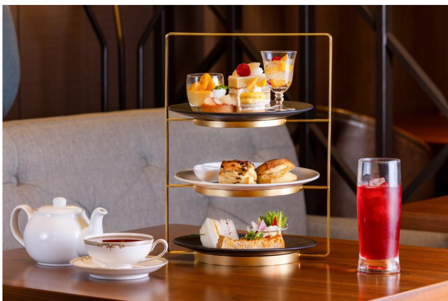
初夏のフルーツ ピーチとマンゴーのスイーツを存分に味わえるアフタヌーンティー