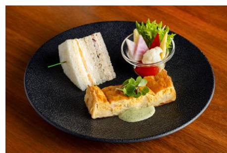
ホテルメイドのセイボリー