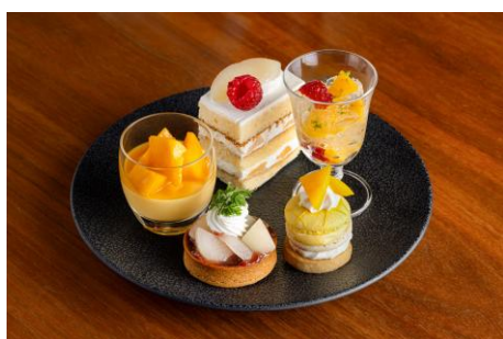
上段には5種類のスイーツ