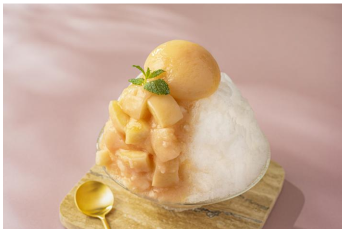
山梨県産の白桃をまるごと1つ使ったプレミアムかき氷「ピーチ」

天井高8.5mの開放感あふれるラウンジ「シーウインド」で、ひんやりとした涼を感じながら、食べごろの国産フルーツを贅沢に使用した夏のスイーツを心ゆくまでお楽しみください。