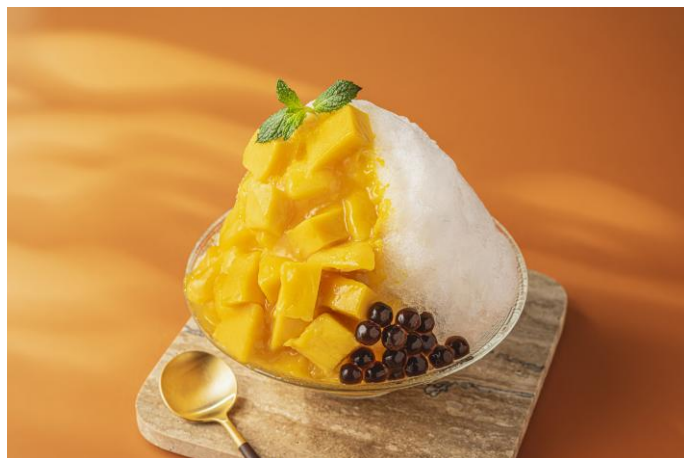
国産マンゴーを存分に味わえるプレミアムかき氷「マンゴー」