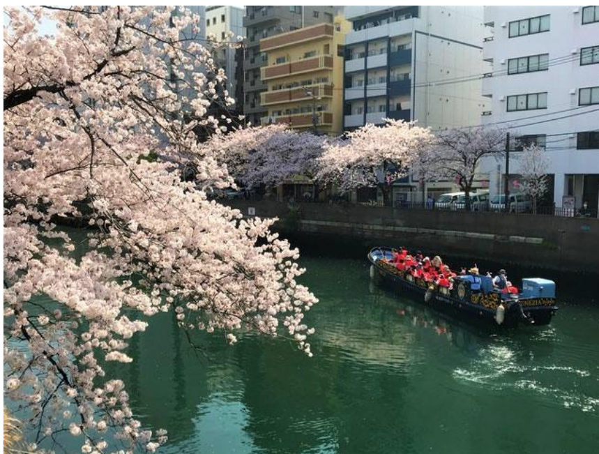
春風が気持ちいいベネチア号で行くお花見クルーズ

今年のお花見は混雑を避け、水上からのんびりと桜並木を眺める雅なスタイルで、この時期しか味わえない特別なひとときをお過ごしください。