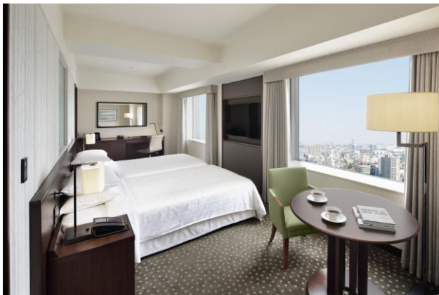
ゆっくりお寛ぎいただける客室

※ベネチア号：大岡川の横浜日ノ出棧橋をホームポートとした小型のクルーズ船。横浜の運河や河川、港を巡りながら横浜の歴史や都市構造、風景、水上空間を楽しむことができる。イタリアのゴンドラの雰囲気をも横濱で味わえるよう「ベネチア号」と名付けられた。