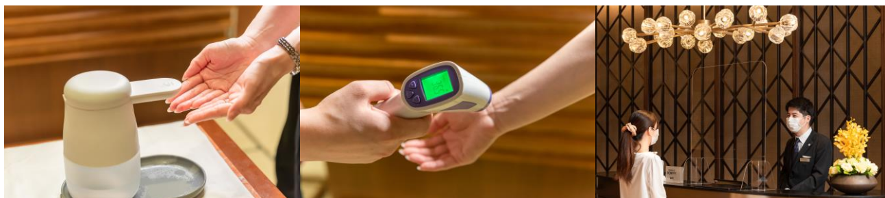
入店時の消毒・検温・接触・飛沫感染予防に関する対策