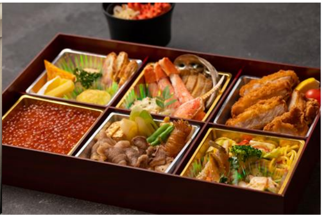
人気の「極撰 北海道フェア弁当【極み】」をお部屋へお届け