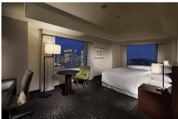
ゆったりとした客室

※神奈川朝食：オールデイブッフェ「コンパス」にて、三浦産の新鮮野菜や相模湾近郊で獲れた本カマスの干物、湘南しらす、横浜中華街の名店「大珍楼」の豚肉焼売等、地産地消の良質食材や名産品を取り揃えたこだわりのメニューです。