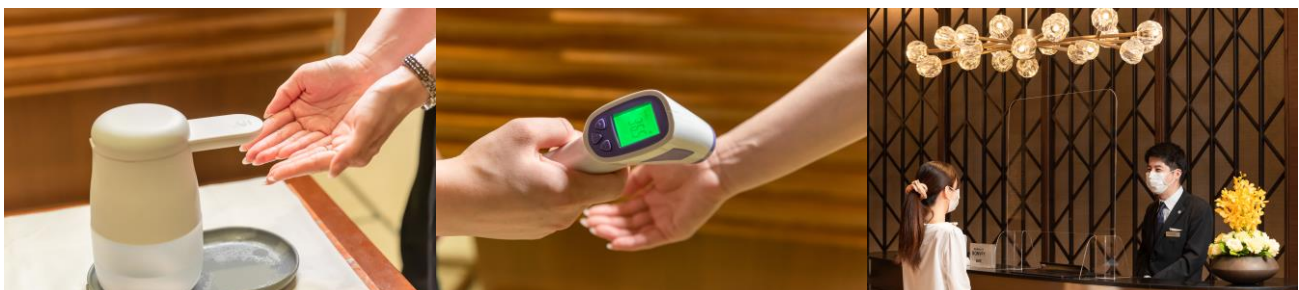
入店時の消毒・検温・接触・飛沫感染予防に関する対策