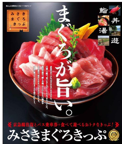
おトクなきっぷ! みさきまぐろきっぷ