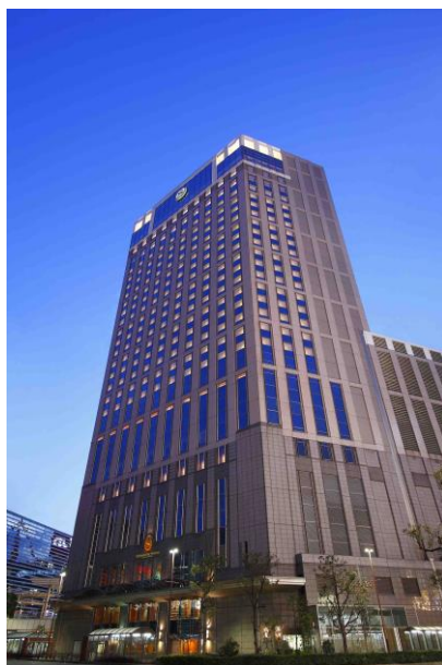
横浜ベイシェラトンホテル 外観

遠方へのご旅行が憚られる今、ご家族やお友達と、またご夫婦やカップルにも嬉しい、ちょっと一息、日常から解放されるリフレッシュ近場旅行をご提案いたします。