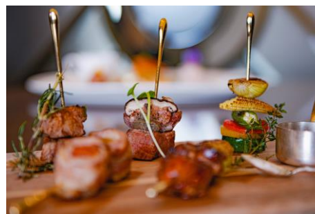
ボリュームたっぷり 5種類のプロシエット