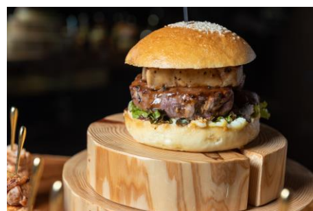
豪華ロッキーニサンド

※お子様、未成年の方はご入場いただけません。 ※写真はイメージです。 ※お料理は全てお一人様分ずつテーブルに お持ちいたします。