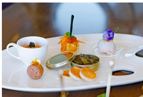
アミューズ盛り合わせ