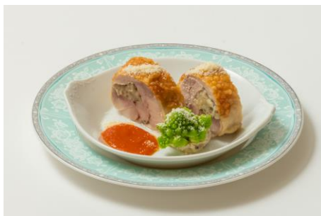
ローストロールチキン

ローストロールチキン（お一人様一皿限定）／生ハムと柚子ピクルスのサラダ／クラムチャウダー オープンサンドウィッチ／ビーフシチュー／フルーツ盛り合わせ／洋梨のデニッシュ