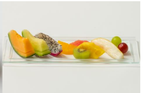
フルーツ盛り合わせ