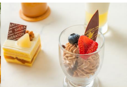
シャンティショコラ（手前）