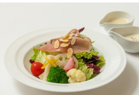
生ハムと柚子ピクルスのサラダ