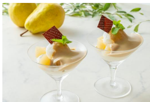
洋梨のパフェ 紅茶のエスプーマ

ポワールミエール／柚子ショコラ ケーキキャラメルポム／柚子のタルト 柚子プリン／洋梨とココナッツのヴェリーヌ 柚子シュークリーム／柚子マカロン フルーツカクテル／シャンティショコラ 洋梨のムース キャラメルソース／洋梨のパイ