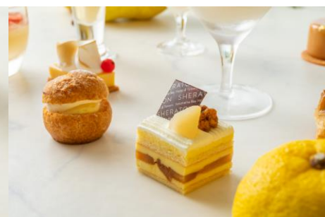
柚子シュークリーム（左奥） ポワールミエール（手前）