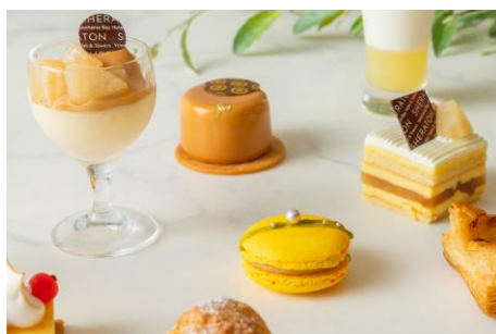
洋梨のムース キャラメルソース（左上） 柚子ショコラ（上中央）