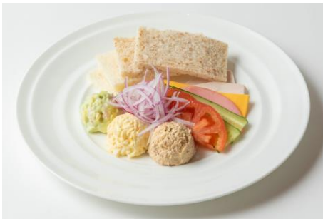
オープンサンドウィッチ