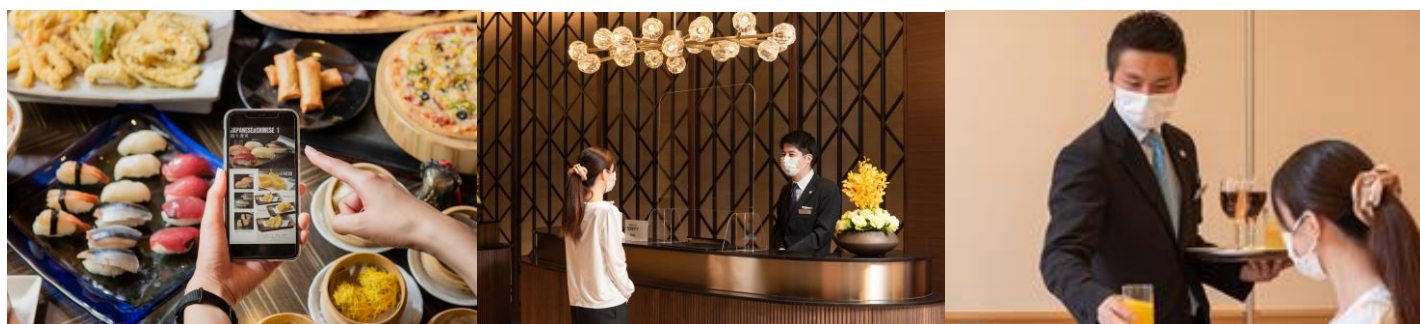
接触・飛沫感染予防に関する対策