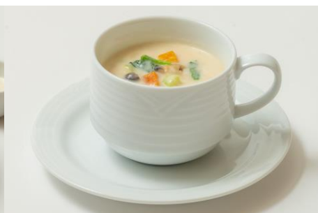
クラムチャウダー