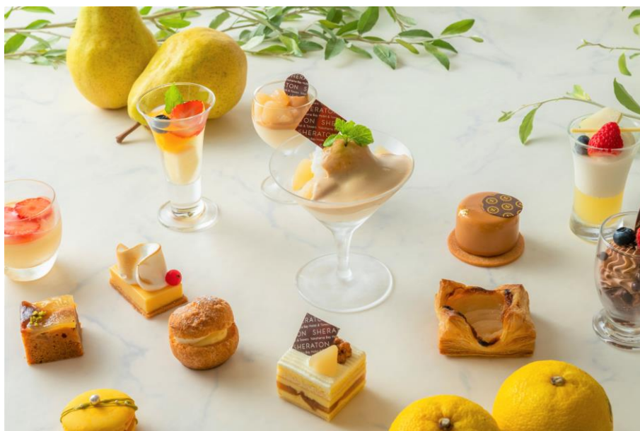
イエローのグラデーションが美しい 洋梨と柚子のスイーツ

ビタミンBが豊富な洋梨と、ビタミンCをたっぷり含んだ柚子を使用した、身体と美容にも嬉しい13種類のスイーツと、肌寒くなるこの時期に濃厚な味わいがたまらない温かいライトミールもふんだんにご用意したオーダー式スイーツbuffetで優雅なひとときを楽しみください。