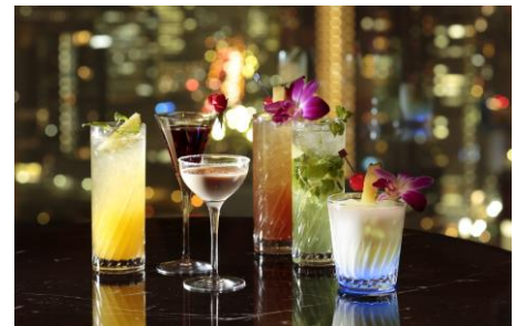
バーテンダーのおすすめカクテル