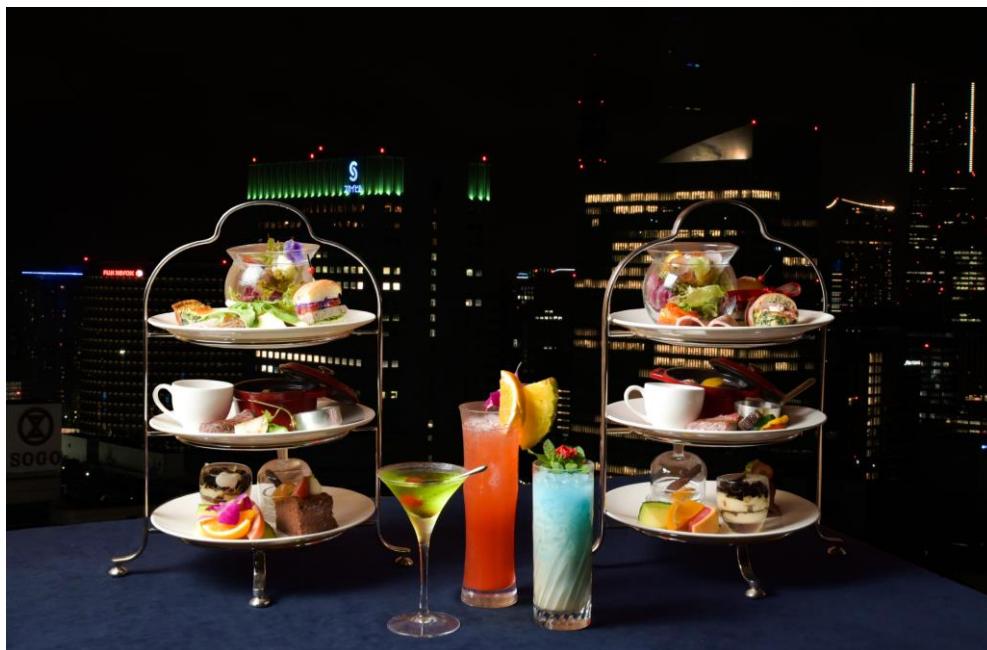
最上階からのきらめく夜景とハイティースタイルのフランス料理

上質な空間が自慢のスカイラウンジでお洒落なフレンチスタイルのハイティーとお好みのドリンクとの組み合わせは、女子会や平日の夜デートに、またお仕事帰りのひとときにもぴったりです。ホテル最上階から眺める横浜の夜景に心奪われるドラマティックな時間をごゆっくりお過ごしください。