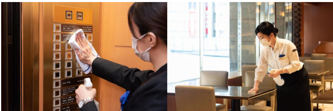
消毒・清掃の徹底