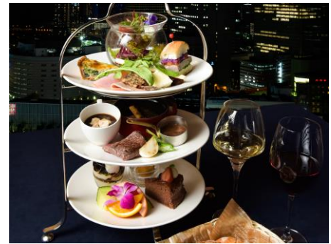
お洒落なハイティースタイル