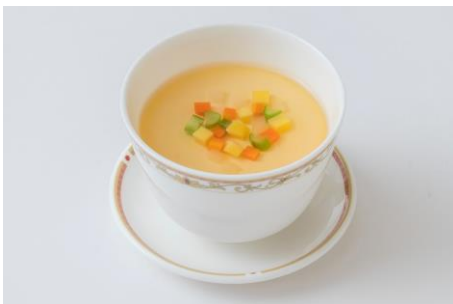
コンソメが効いたロワイヤル

ロワイヤル（洋風茶碗蒸し）※お一人様1皿限定 釜揚げシラスとわかめのサラダ オニオンドレッシング添え オープンサンド/ビーフシチュー ミルファンティ（ソーセージとグリーンピースの玉子スープ） カマンベールチーズ&ドライフルーツ/季節フルーツの盛合わせ/チェリーデニッシュ