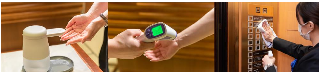
入店時の消毒・検温、館内施設における消毒・清掃の徹底