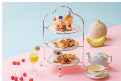
彩り豊かなスイーツやセイボリー

ドイツの老舗紅茶メーカー「ロンネフェルト」や各種コーヒー計23種類よりお選びいただけます。