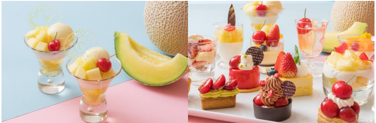
ジューシーな果肉がゴロゴロ「クラウンメロンパフェ」

クラウンメロンショートケーキ/ピスタチオスリズ/メロンシュー・ア・ラ・クレーム チェリーパイ/チーズケーキ/タルトスリズ/ショコラスリズ ココナッツブラマンジェ/サイダージュレ&アセロラ/赤肉メロンムース/トライフル プリン・ア・ラ・モード