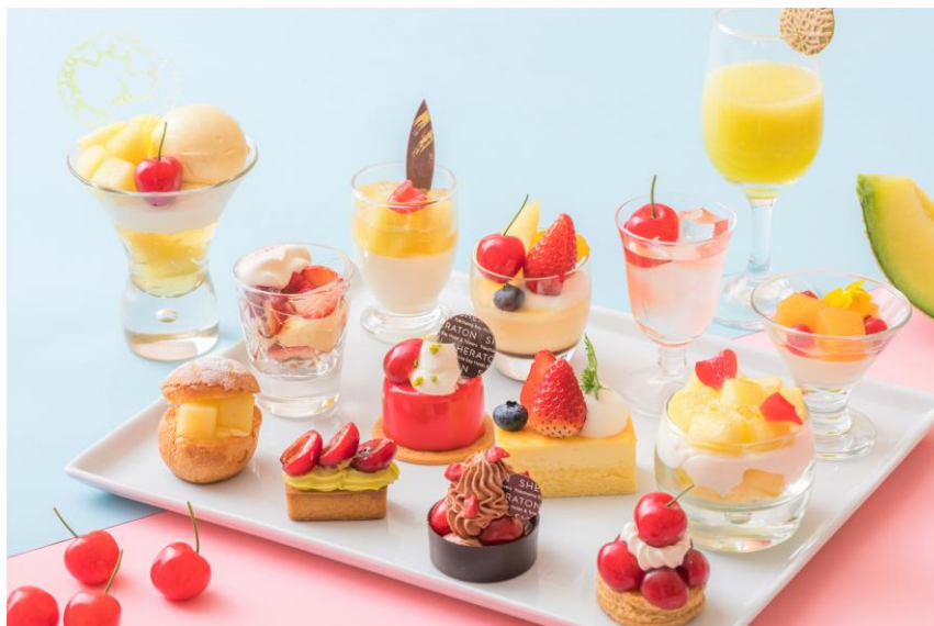
クラウンメロンと佐藤錦のカラフルなデザートの数々

お友達とのひと時に、母の日や父の日のお祝いに、爽やかな初夏の夕暮れをラウンジ「シーウインド」のSweets Paradeでごゆっくりとお過ごしください。