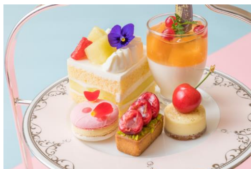
メロンとチェリーを存分に楽しめるスイーツ5種