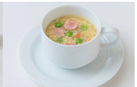
優しい味わいミルファンティ