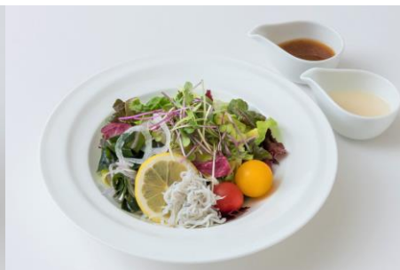
釜揚げシラスとわかめのサラダ