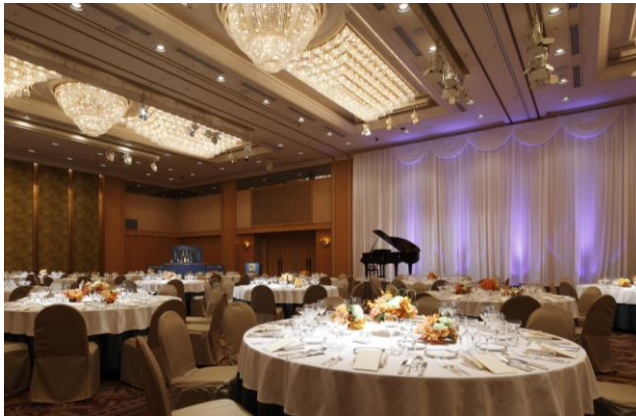
ディナーショー会場「日輪」