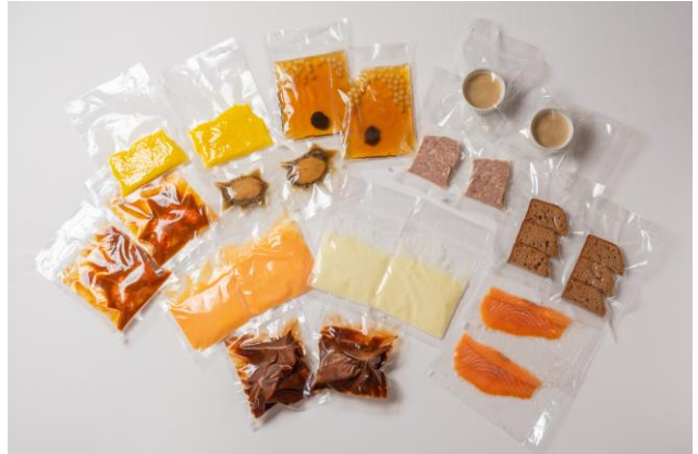
個別に真空包装され冷凍のまま配送