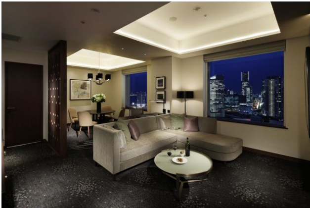
ジュニアスイート(71㎡)