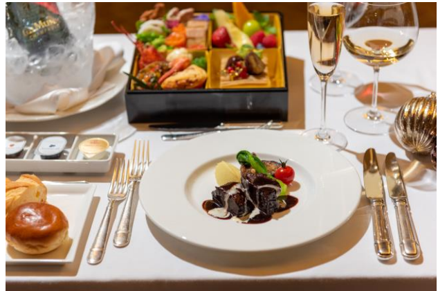
ルームサービスでご提供する豪華ディナーコース