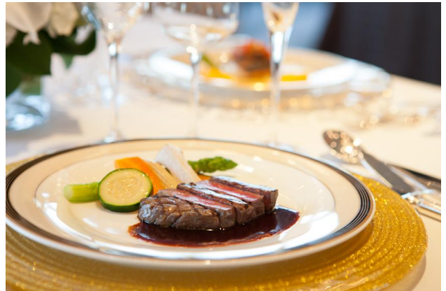
特別フレンチコース