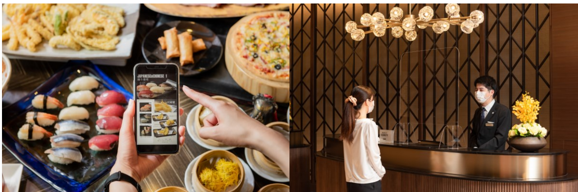
接触・飛沫感染予防に関する対策