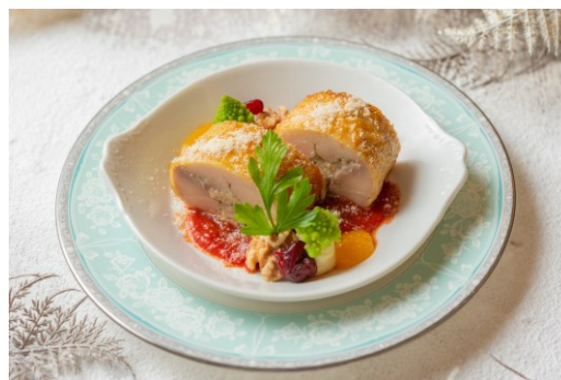
ロールローストチキン