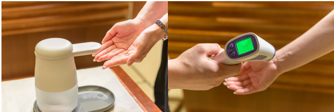
入店時の消毒・検温