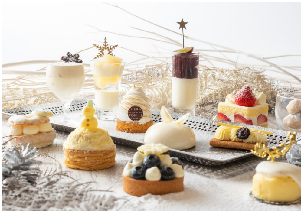
新感覚の白スイーツコレクション

腕の確かなパティシエが自信を持ってお届けする白スイーツの世界を心行くまでお楽しみください。