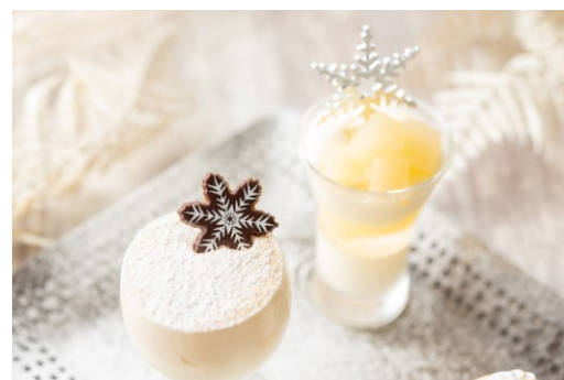
冬の訪れを感じるグラスデザート