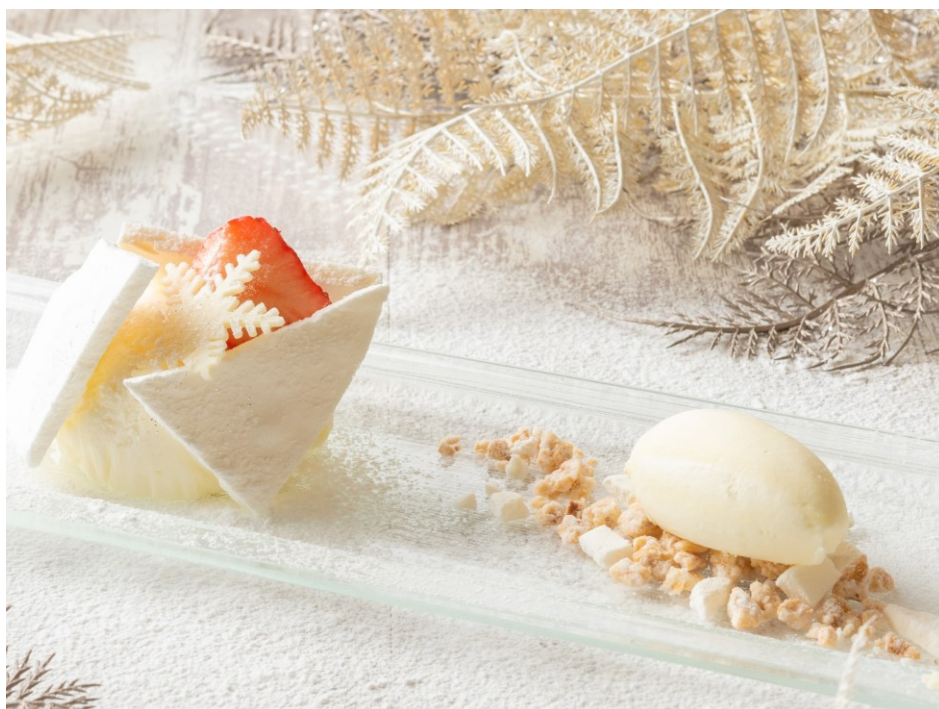
【スペシャルスイーツ】クレームダンジュ ミルクソルベ