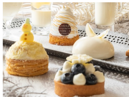
可愛いデコレーションも魅力の一つ