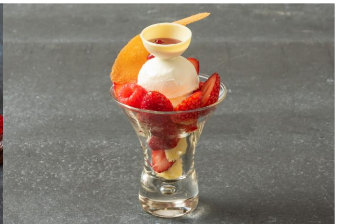
ホワイトチョコレートがとろけるストロベリーパフェ