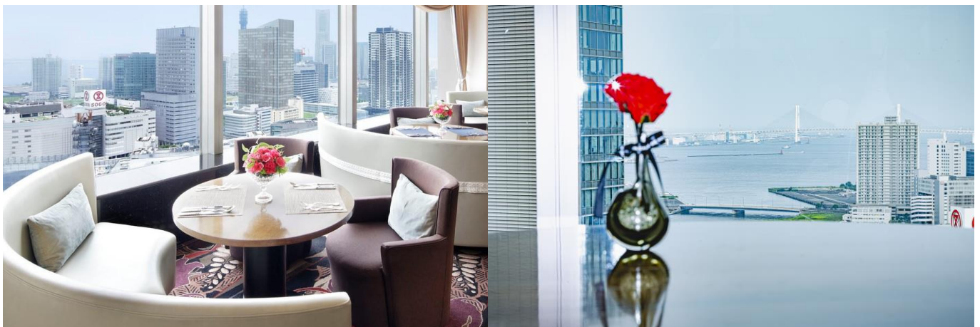
ホテル最上階「ベイ・ビュー」店内・眺望

ストロベリーシェイク／コーヒー／紅茶（ロンネフェルト）／ウーロン茶／オレンジジュース／グレープフルーツジュース