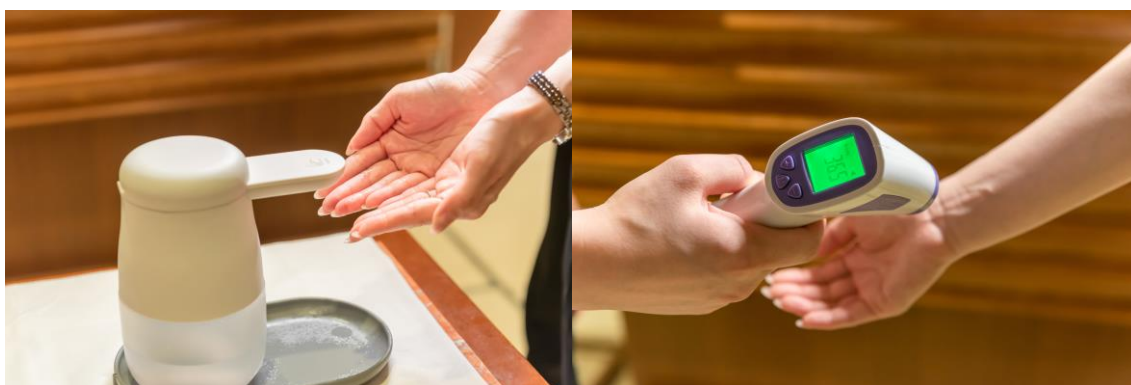
入店時の消毒・検温