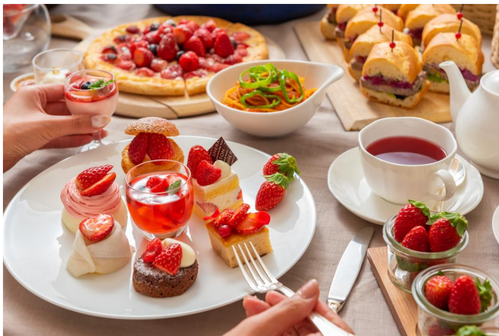
ホテル最上階からの景色とストロベリースイーツで至福の時間を

ひと足早い春を感じさせるストロベリースイーツとともに、華やかで贅沢なアフタヌーンのひとときをお過ごしください。