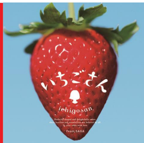
国産ブランド苺 佐賀県産「いちごさん」を起用