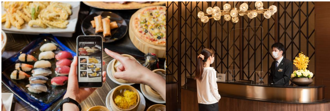
接触・飛沫感染予防に関する対策