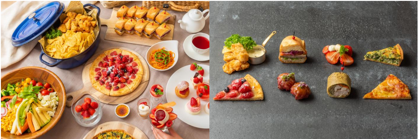
バラエティに富んだホテルならではのサイドメニュー

国産牛サーロインのローストビーフ手鞠寿司風（お一人様1皿限定）／自家製パテ・ド・カンパニーのサンドイッチ／タラモサラダ／チョレギサラダ／グリーンサラダ／苺とトマト、モッツアレラチーズのサラダ／チキンと野菜のラップサンド／ベーコンとハウレン草のキッシュ／スパゲッティ・カルボナーラ風／ポテトフライ／スパゲッティ・ナポリタン／本日のスープ／マリナーラ風ピザ／フィッシュ&チップス