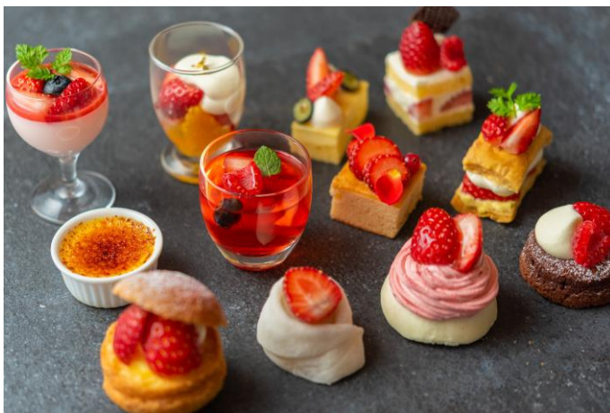
苺尽くしのかわいいスイーツ

ストロベリーパフェ／ストロベリーショートケーキ／ストロベリーモンブラン／苺のミルフィーユ ガトーショコラ／チーズケーキ／ストロベリーバニラムース／ストロベリーロマノフ／ストロベリー ムース／苺のゼリー／苺大福／苺のシュークリーム／フルーツグラタン／クレプシュゼット スト ロベリー／苺とマスカルポーネのピザ／アイスクリーム 苺 バルサミコクリーム／ストロベリーソル ベ マスカルポーネのエスプーマで／フレッシュ苺 佐賀県産「いちごさん」