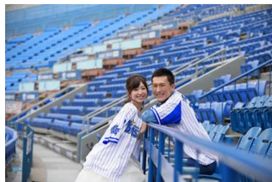
お気に入りのユニフォームで思い出のショット