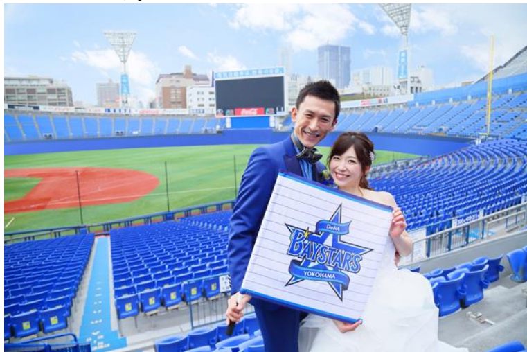
横浜スタジアムで思い出に残るフォトウェディング

人生最良の日にふさわしい、幸せと感動の一場面を生涯の記憶に残していく「新しい Happiness のかたち」をご提案してまいります。