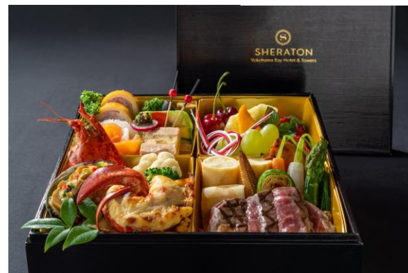
豪華お重立ての御祝い膳