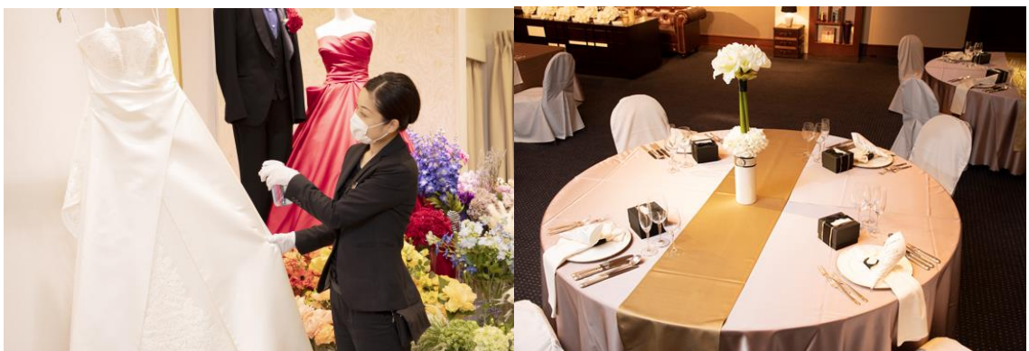
飛沫感染予防・3密回避への取り組み