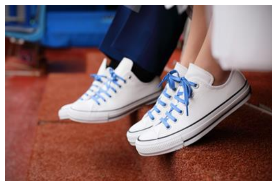
ブルーがアクセントのペアスニーカー