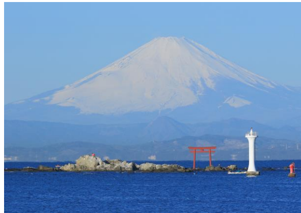
海岸から広がる爽快な風景