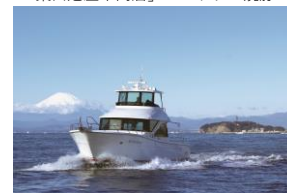
葉山マリーナでクルージング