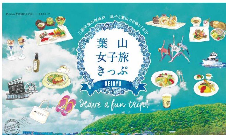
ぶらり、のんびりごほうび旅「葉山女子旅きっぷ」