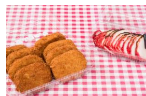
「葉山旭屋牛肉店」コロッケと焼豚