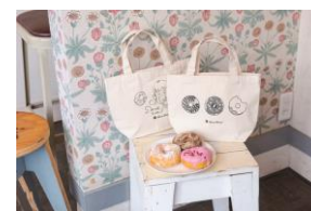
かわいいミサキドーナツ