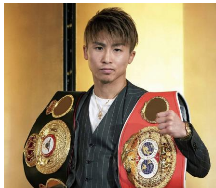
大橋ボクシングジム所属 世界中が注目するボクサー 井上 尚弥氏