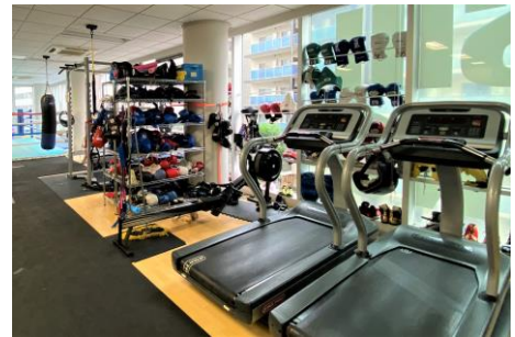
充実のトレーニング施設