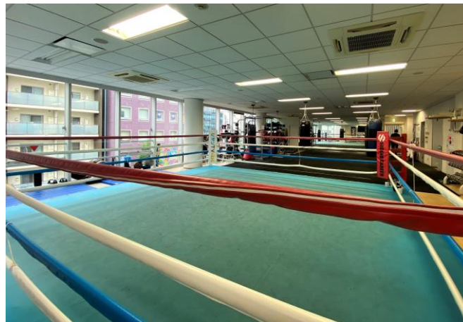
横浜ベイシェラトンホテルから徒歩5分 広々とした「大橋ボクシングジム」内観