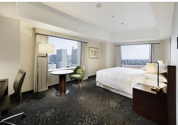
広々としたお部屋で寛ぎの時間を