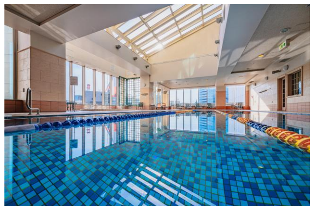
天窓から日差しが差し込む明るいホテル屋内プール