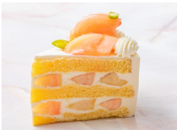
新潟白根(しろね)の桃を贅沢に使用