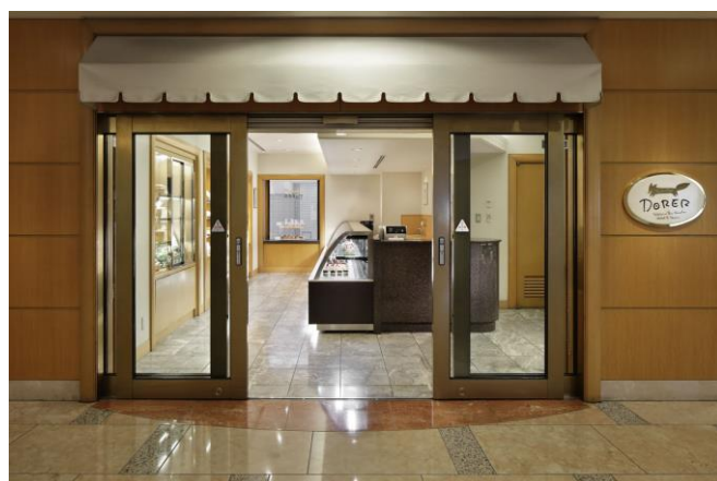
ホテル地下1階にあるペストリーショップ「ドーレ」