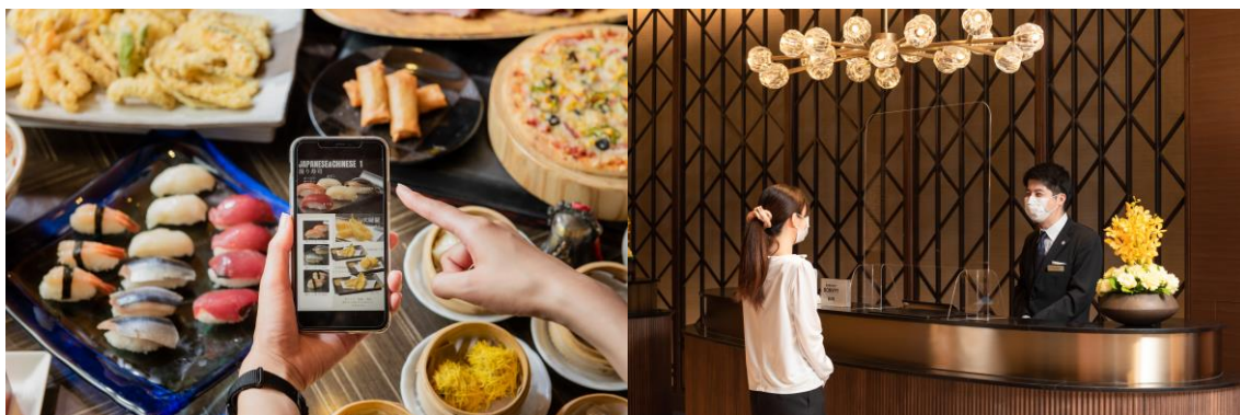
接触・飛沫感染予防に関する対策