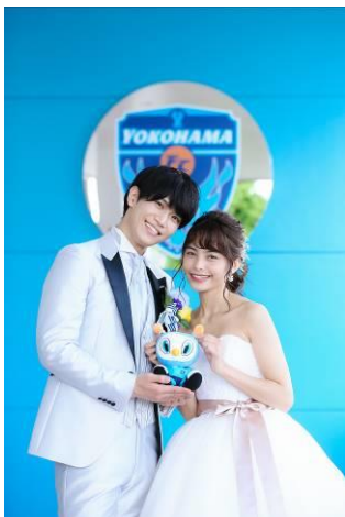
クラブエンブレムで記念フォト

横浜で迎える人生最良の日にふさわしい幸せの記録、「新しいウエディングのかたち」を横浜ベイシェラトンが実現いたします。