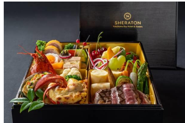
豪華お重立ての御祝い膳