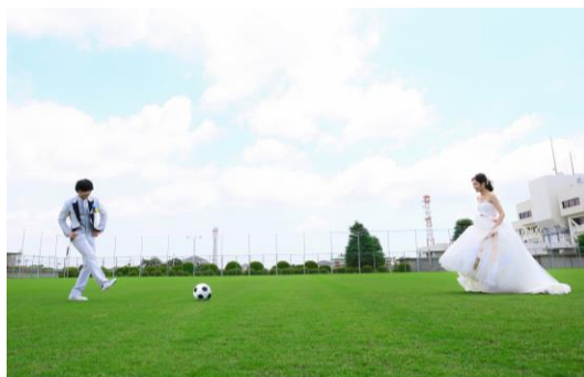
広々としたグラウンドで開放的なフォトシューティング