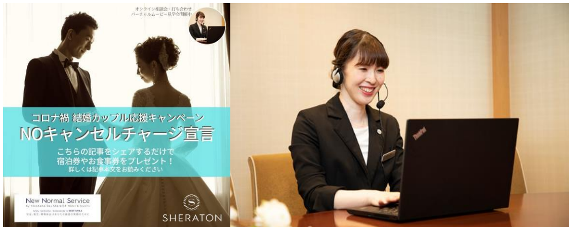
横浜ベイシェラトンの安心したサポート体制

直接ホテルへご来館いただけない場合にも、おふたりのご要望を丁寧に向い、イメージに合わせた会場を ZOOM オンラインでご紹介いたします。よりリアルなご体験をしていただくために、バーチャル動画を使用し、披露宴会場やチャペル、神殿はもちろん、横浜駅から当ホテルまでの道のりやホテルメインロビー、エレベーターの場所までご来館時と同様の行程で、ホテル全館をご案内いたします。