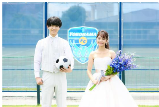
「FOUR SIS & CO.」で選んだお好みの衣装で