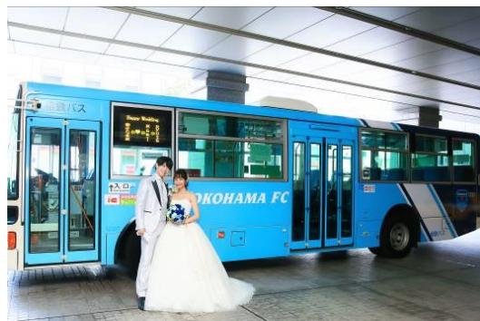
「相鉄バス×横浜 FC ラッピングバス」で貸切送迎