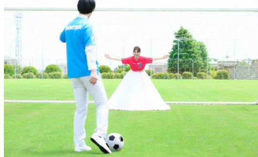
楽しいシュートシーンも記念に残る一枚