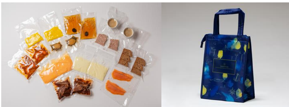
包装資材は、環境に配慮したリユース可能な「ECO バッグ」で配送

リユース可能な「横浜ベイシェラトン オリジナル ECO バッグ(保冷用)」でお届けいたします。