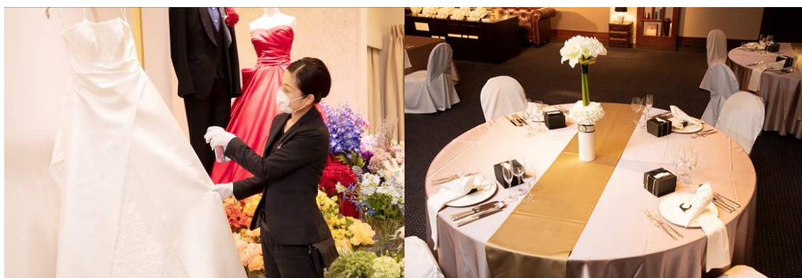
飛沫感染予防・3密回避への取り組み