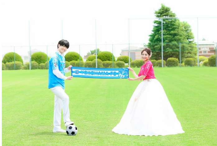
横浜 FC のユニフォームを着て美しい芝のグラウンドで撮影