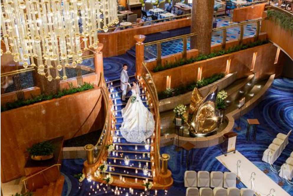
人生最良の幸せに包まれる瞬間を共に分かち合う

横浜ベイシェラトン ホテル&タワーズがご提案する結婚式は、新郎新婦だけでなく、今までおふたりを育ててきた御両家や、見守ってきたゲストの方々にとっても、大切な日であると考えております。大切な結婚式の瞬間が心に刻まれ、10年後、20年後も色あせない思い出として、いつまでも記憶に残るよう、おふたりらしい結婚式を新しい時代の価値に即したおもてなしでお迎えしてまいります。