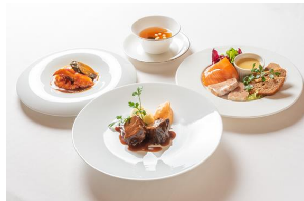
上質な厳選素材を使用したコース仕立て