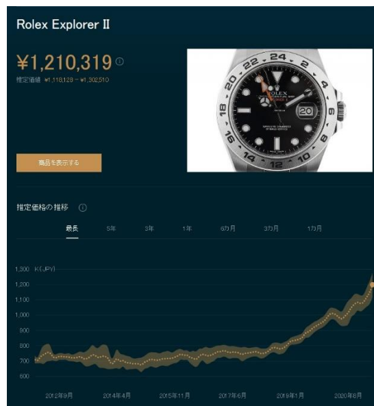
ロレックス エクスプローラー II Ref.216570