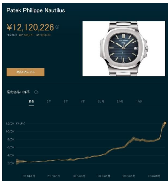
パテック フィリップ ノーチラス Ref.5711