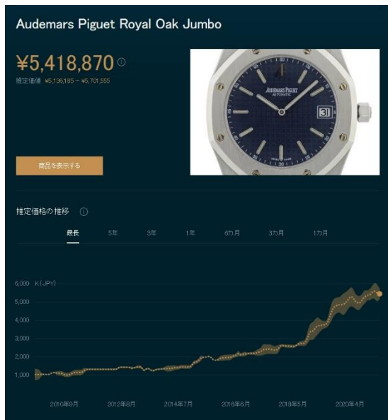
オーデマピゲ ロイヤルオーク “ジャンボ” エクストラシン Ref.15202ST

2021年1月にオメガはスピードマスター ムーンウォッチの2モデルの生産終了を発表し、その直後に同シリーズから8つの新作モデルを発表しました。発売直後に、旧2モデルの中古品の価格は急増し、現在は約59万円となっています。