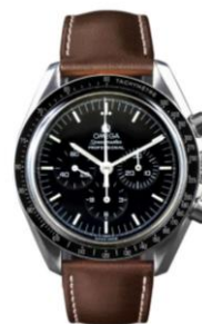
オメガ スピードマスター