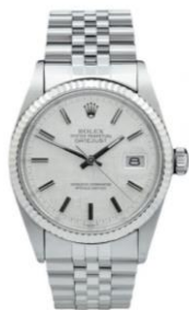
ロレックス デイトジャスト

昨年度に引き続き、2021年も1位にRolexのDatejust、2位にRolexのSubmarinerがランクイン。2020年は、GMT-Master IIが4位にランクインしていましたが、2021年度ではDaytona (デイトナ) がシェアをあげ、5位にランクインしました。