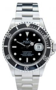
ロレックス サブマリーナ