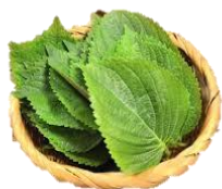
えごま油(しそ科の種子)