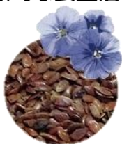
アマニ油(亜麻の種子)

近年、注目されているオメガ3脂肪酸は、必須脂肪酸と呼ばれる不足しがちな栄養素の一つです。昔の日本人は魚でオメガ3を十分に取っていましたが、食の欧米化もあり、摂取量が減少。オメガ3系のオイルである「えごま油」や「アマニ油」などを1日スプーン1杯、毎日の食事に取り入れることで健康バランスに役立ちます。