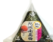
おにぎりシリーズ 78円 (通常価格85円)

お子さまのおやつやティータイムのお供にぴったりの人気のミニサイズのパンシリーズを 9月6日まで値下げいたします。ぜひお試しください。