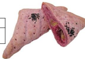
紫芋の三角パイ 114円

鹿児島県種子島産の安納芋の餡を包み、表面にココアパウダーを付けて焼き上げました。