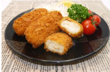
広島県産カキのクリームコロッケ (1個 98円、2個 196円、3個280円)

広島県産カキを使用し、サクサクの衣の中に濃厚でクリーミーなソースがたっぷりに入ったクリームコロッケです。