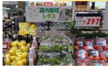
ひばりが丘店売場