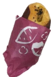
安納芋の焼きいもパン 114円

まだまだ暑い日が続きますが、秋を感じる商品をひと足早くお届けします。第一弾は、安納芋や紫芋を使ったパン。「紫芋の三角パイ」は 10月4日まで、「安納芋の焼きいもパン」は、11月1日までの期間限定での発売です。この機会にぜひ秋の味覚を存分にお楽しみください。