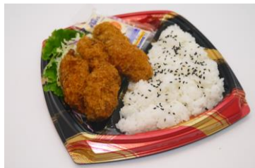
サクサク衣のカキフライ弁当 (398円)

お盆が明けても厳しい残暑続く中、強い日差しで積み重なった夏の疲れを解消する惣菜を集めた「秋の味覚フェア」を開催中です。“海のミルク”と称されるミネラルたっぷりのカキを使ったメニューや、ガーリックを使ったメニューなど、食欲を増進する一品をどうぞお楽しみください。