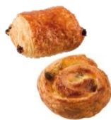
ミニパンオショコラ 6個 250円(通常価格280円)