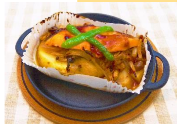
鮭ときのこのガーリックバター醤油焼 (398円)

広島県産カキを使用し、サクサクの衣の中に濃厚でクリーミーなソースがたっぷりに入ったクリームコロッケです。