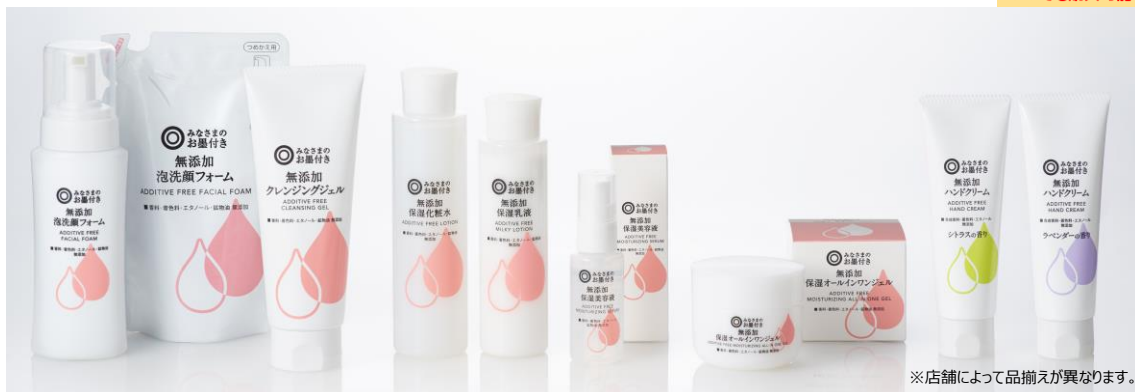
※店舗によって品揃えが異なります。