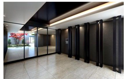
エントランスホール (完成予想パース)