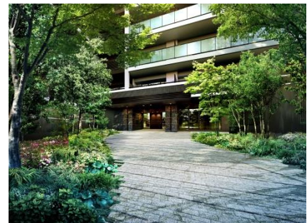
エントランス (完成予想パース)