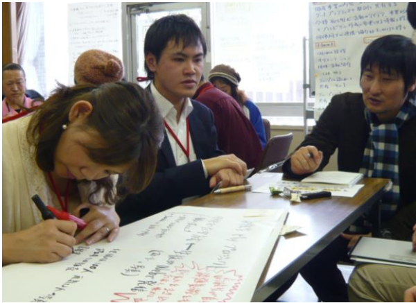
グループごとにアイデアを話し合う