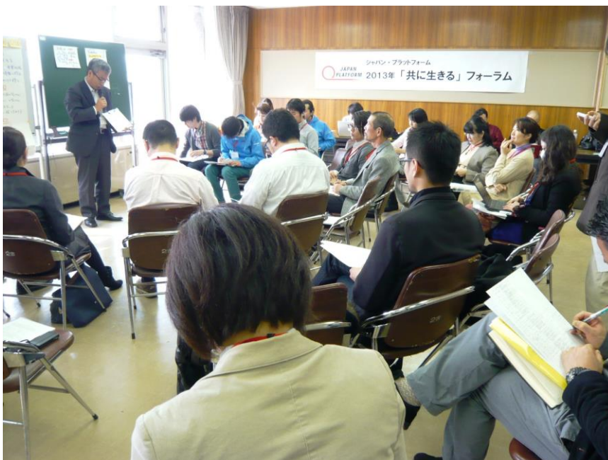
地域復興分野の共に生きるフォーラムの様子

なお、「共に生きる」ファンドは既に11次までの募集・助成を経て、現在第12次募集分の検討を行っています。次回13次応募期間は2013年5月を予定しています。JPF は引き続き、「共に生きる」ファンドの助成、助成団体の皆さまの交流を通じ、被災地の復興に向け、支援を継続していきます。