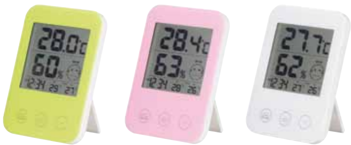
DO02GR(グリーン) DO02PK(ピンク) DO02WH(ホワイト)