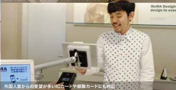
外国人客からの要望が多いICカードや銀聯カードにも対応