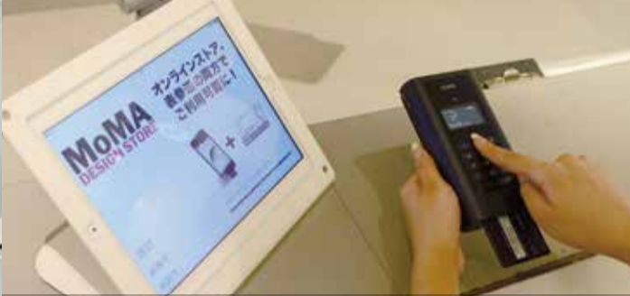
余計な配線などがなくなり、レジ周りはすっきりとした印象に