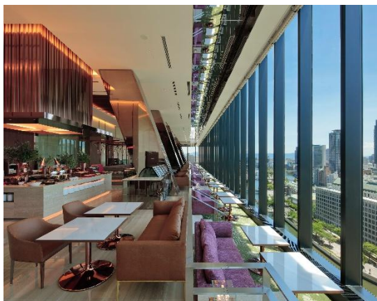
※朝食会場（カンデオホテルズ大阪ザ・タワー）