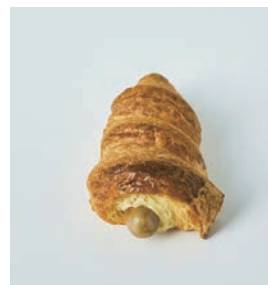
ブラックペッパー ハニーマスタードとの組み合わせ