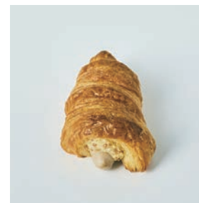
バジル チーズマスタードとの組み合わせ

□お問い合わせ 株式会社大近 tel. 06-6442-7627 担当：松山・北村