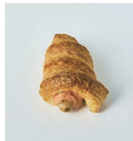
プレーン オーロラソースとの組み合わせ