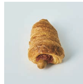
チョリソー サルサソースとの組み合わせ