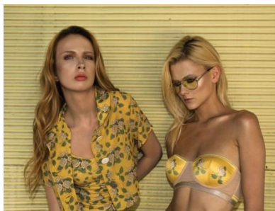
Noblesse Oblige 18,360円(税込)