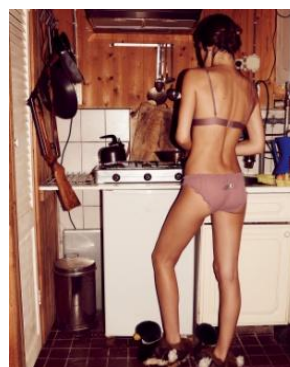
Love Stories Intimates 4,320円(税込)