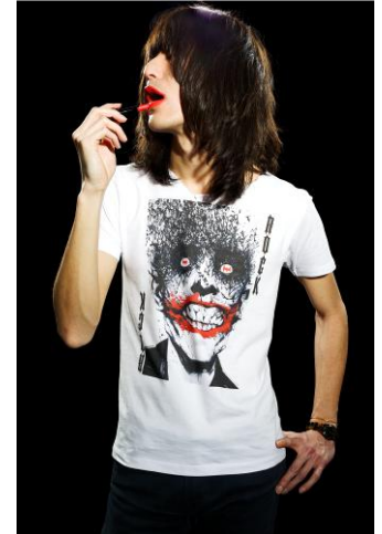
TM & © DC Comics. (s14)