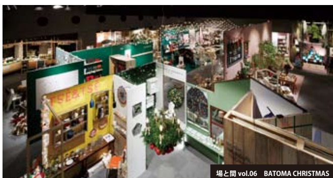
場と間 vol.06 BATOMA CHRISTMAS