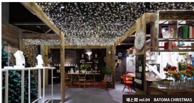
場と間 vol.04 BATOMA CHRISTMAS

空間を楽しむ展示会としても定評のある「場と間」では、テーマごとに異なる空間演出を行ってきました。今回「BATOMA CHRISTMAS」が打ち出すのは、ニューヨークのホリデーマーケットをイメージした空間。宝探しをするような、わくわくした気持ちを高める「BATOMA HOLIDAY MARKET（場と間ホリデーマーケット）」をお楽しみください。