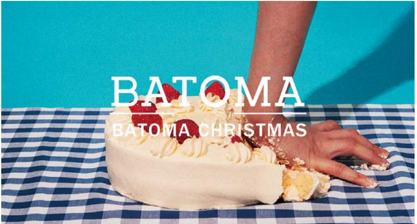
※「場と間 vol.08 BATOMA CHRISTMAS」キービジュアル

アッシュ・ペー・フランス株式会社 場と間 が主催する、日本で唯一のクリスマスに特化した合同展示会「場と間 vol.08 BATOMA CHRISTMAS (場と間クリスマス)」を、2015年5月29日(金)・30日(土)の2日間、ラフォーレ原宿6階 ラフォーレミュージアム原宿にて開催します(27日・28日はビジネスのための招待制)。クリスマスシーズンに屋外で開催されるニューヨークのホリデーマーケットのような空間には、デコレーションアイテムやインテリア雑貨、グロサリーなど、クリスマスだけでなく、家族や友人、恋人へのギフトにもぴったりのアイテムが揃います。出展者数は、過去最多の計47社！日本初上陸のチョコレートドリンクや、人気インテリアブランドから初披露されるジュエリーライン、展示会に初出展するポर्टランド発のグリーティングカードなど、ここでしか出会えないアイテムも多数登場します。各ブースでは、メーカーと対話しながらバイヤー気分で買い物を楽しめます(一部除外あり)。また、毎回話題を呼ぶインスタレーションでは、時代を経て消滅しつつある技術を現代のデザインで再構築したネオンアートを紹介。会場内に登場する楽しいフォトスポットと共に、訪れる人の感性を刺激します。「場と間」が提案する“あたたかいクリスマス”をお楽しみください。