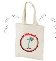
WASHROOM TOTE BAG 3,240 円(税込)