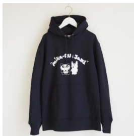
Hoodie 12,960 円(税込)