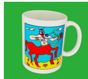
マグカップ 1,620 円(税込)