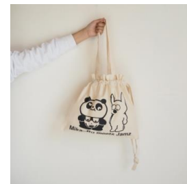
Medium tote 5,940 円(税込)