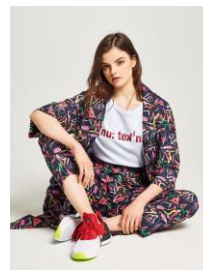
ローブシャツ 14,040 円(税込)