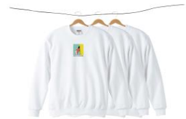
WASHROOM SWEAT 6,480 円(税込)