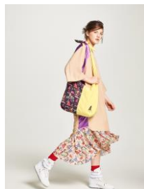
トートバック 8,532 円(税込)