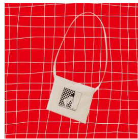
WASHROOM SACOSHE 3,240 円(税込)