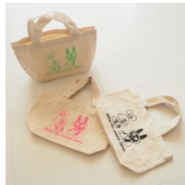
Small tote 各 2,700 円(税込)