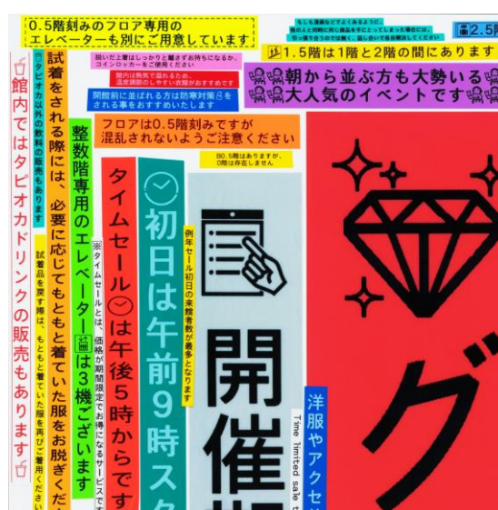
1.5階は1階と2階の間にあります