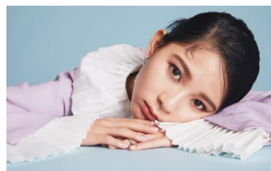
ミチ(姉) 1998年3月6日生まれ。