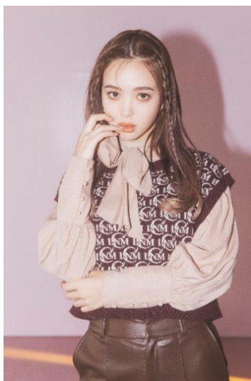
ボウタイブラウス 7,000円(税込)