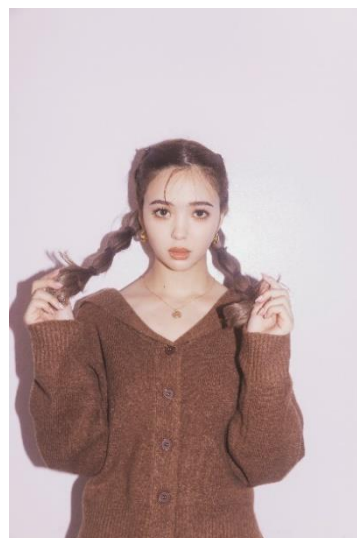
セーラーカラーニット 7,500円(税込)