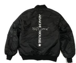
AYH CROSS LOGO PRINT MA-1 JACKET 23,000 円(税込)