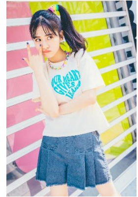
ぶっくりTシャツ 3,850 円(税込) タックプリーツショートパンツ 4,389 円(税込)