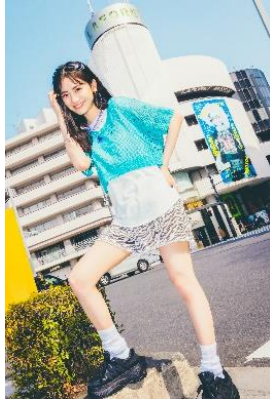
メッシュレイヤードフードトップス +Tシャツ セット 4,389 円(税込)

アンビー×ピンクラテのスペシャルコラボ商品を販売するポップアップストアが期間限定でオープン。ティーンズに人気の令和ギャルをスペシャルコラボで発信いたします。期間中は、トップス・ボトムス・キャップなどのコラボ商品を期間限定で先行発売開始。トレンドの令和ギャルスタイルを提案いたします。