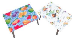
ファンシーちゃぶ台 ¥4,290(税込)