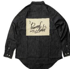
AYH SIDE SLIT DENIM SHIRTS 23,000 円(税込)