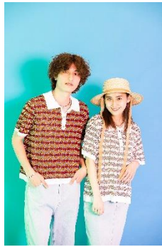
HEYUMM レトロジャガードポロニット 3,960円(税込)