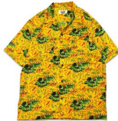
AYH LAND PATTERN ALOHA SHIRTS 23,000 円(税込)