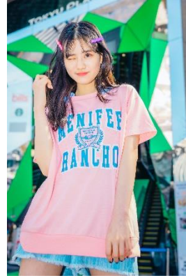
取り外し可能衿付半袖トップス 3,289 円(税込)