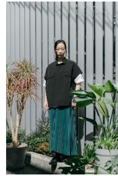
Uiscel マルチポケットボリュームベスト 6,900円(税込)