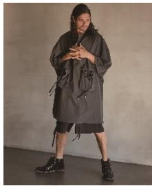
5分フーディ 19,800円(税込)