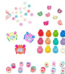
ヘアアクセサリ ¥90~330(税込)