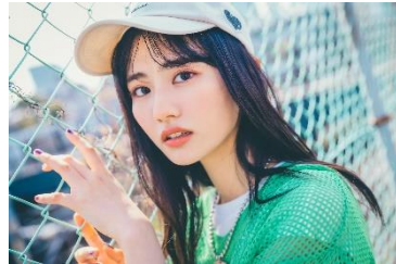
ロゴ CAP 2,750 円(税込)