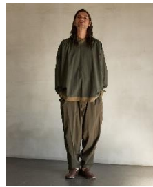
アシンメトリーTEE 13,200円(税込)