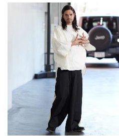
肩ボタン7分シャツ 16,500円(税込)