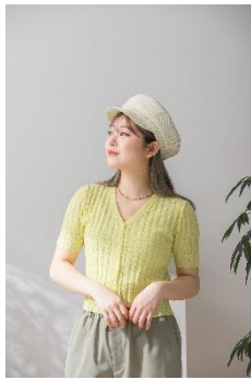
HEYUMM コンパクトショートカーディガン 3,960円(税込)

【「WELEDA」限定5点セット内容】WELEDA コラボパッケージ T シャツ、オーガニックコットンショップバッグ、WELEDA ホワイトーチボディオイル(マッサージ用オイル)10mL、WELEDA スキンフード(全身用クリーム)30mL/10m