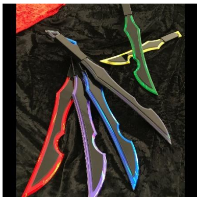
ロミングカトラス 16900 円(税込)