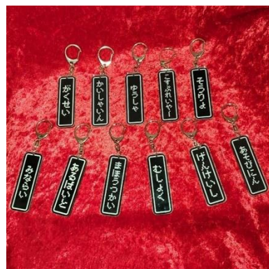
職業キーリング 1500 円(税込)