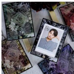
フォトカードアクリルフレーム モトーンフラワー 1,100 円(税込)

今回のPOP UP SHOPでは新商品 7アイテムを発売し、税込 5,000 円以上お買上げのお客様へ先着でノベルティをプレゼントします。