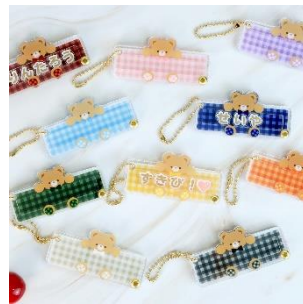
おなまえカスタムネームタグアクリルフレーム だっこベア 990 円(税込)