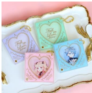
クラシカルハートミニアクリルフレーム 880 円(税込)