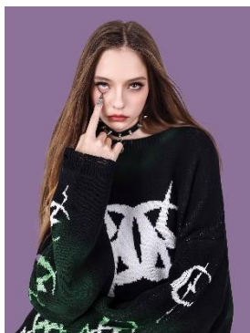
コントラストルーズ厚手セーター 33,000円(税込)