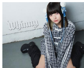
ギンガムチェックシャツ 6,930円(税込)