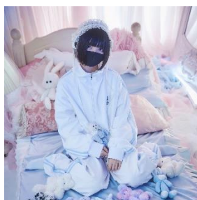
くまきち × Whinny コラボ限定 刺繍ジャージ 7,920円(税込)