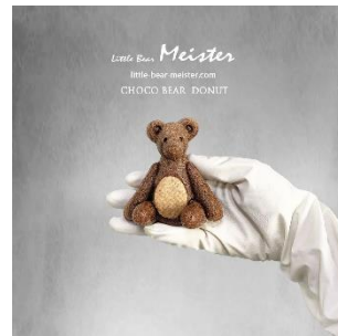
チョコベア 450円(税込)