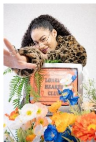
【Metal square】Y2K series 2,480円(税込)