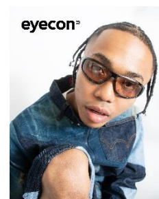
【SPORTS Type】Modern series 2,980円(税込)