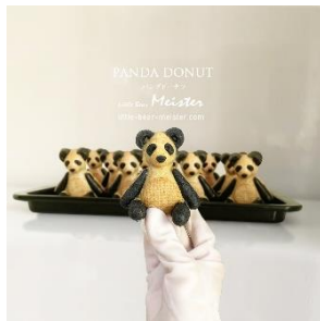
パンダドーナツ(原宿限定) 450円(税込)