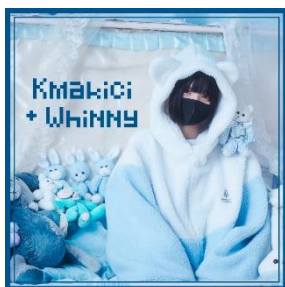
フード付きボアアウター 9,900円(税込)