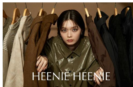
Asymmetry Tuck PU Leather Jacket 7,980 円(税込)