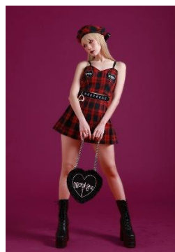
トップス 9,900円(税込) スカート 13,200円(税込)