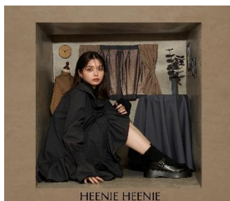
Asymmetry Shirring Tops 7,480 円(税込)