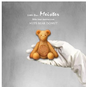
ナッツベア 450円(税込)