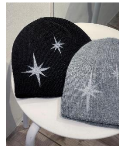
octagram beanie 5,280円(税込)