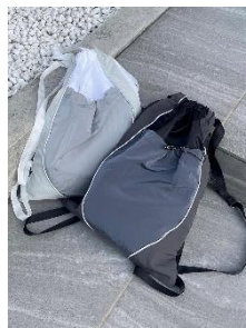
reflector gymsack 6,600円(税込)