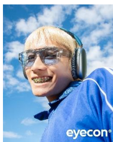
【Goggley Teardrop】MODE series 2,980円(税込)