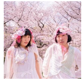
「このよのはる」 練り歩きパフォーマンス