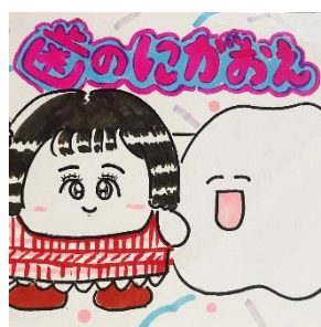
5月4日(土・祝) 歯のマンガ @hanomanga