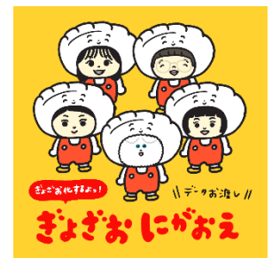
5月3日(金・祝) GYOZAO @gyozao.gyozaao