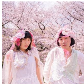
4月28日(日) このよのはる @konoyonoharu_

ゴールデンウィークは日替わり似顔絵イベントを開催。参加方法や詳細は各アーティストの SNS をご覧ください。