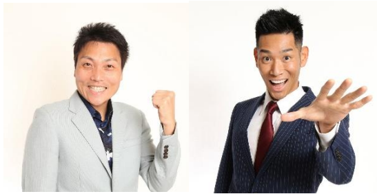
「未確認生物の世界展」 サバナハ木、レイザーラモンHG が来場