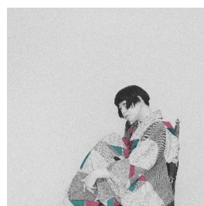
5月6日(月・休) 朝際イコ @icoasagiwa815