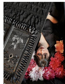
GRAVE TOKYO 入棺体験