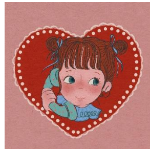
4月29日(月・祝) momoa days @pinkoijp