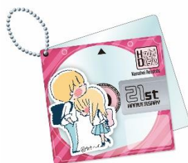
MD 風ミラー 1500 円(税込)