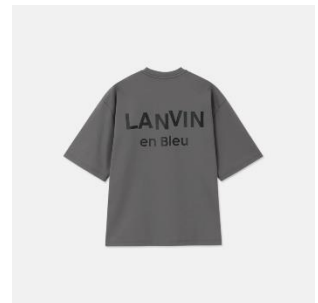
“エssenシャル”Tシャツ 11,000円(税込)