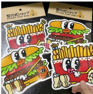
BIG ステッカー 700円(税込)