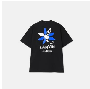
バックプリント “マルグリット”Tシャツ 11,000円(税込)