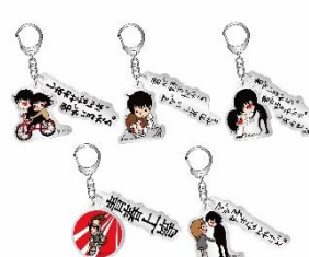
青春文字アクキー 1,300 円(税込)