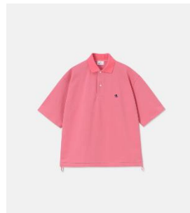
ヘビーピケカラーポロシャツ 15,400円(税込)