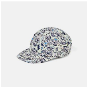
“アルベール”オールオーバー プリントジェットキャップ 9,900円(税込)

135年の歴史を持つフランスのクチュールメゾン「LANVIN」のイメージを受け継ぎ、タイムレスなデイリーウェアを展開するユニセックスブランドとして、2024年4月1日にローンチされた「LANVIN en Bleu ESSENTIAL」。幅広い世代でファッションを楽しめるアイテムを揃えます。グラフィックデザイナー・渡辺明日香がディレクションする内装で、ブランドの世界観に触れられる、特別なリアルショップです。