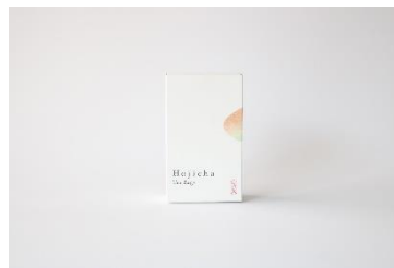
Hojicha Tea Bags 1,609円(税込)