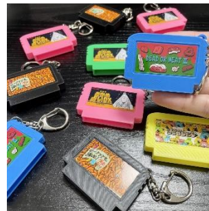
未来形カセット 1,200円(税込)