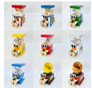
おすわりフィギア 6,000~10,000円(税込)