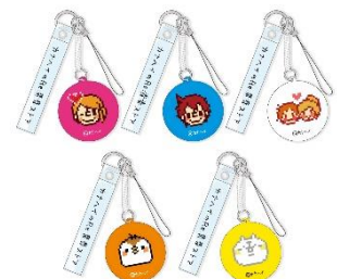
液晶クリーナーストラップ 1,500 円(税込)