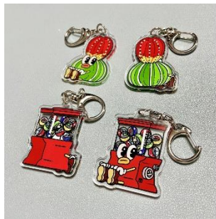
リバーシブルアクリキー 800円(税込)