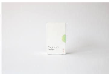
Sencha Tea Bags 1,879円(税込)

空洞とは、お茶を飲んでぼーっとすること。空洞庵は、その魅力を届けるべく、お茶作りから取り組む専門店です。静岡の梅ヶ島という山奥で、世にも奇妙な在来という茶の樹を、農薬や肥料を使わずに育てています。古典的なお茶作りを復活させ、そこに現代の感覚を融合させた空洞庵のお茶。デザイナー・平林凌雅と手を組み、“ゆらぎ”のある一杯をお届けします。