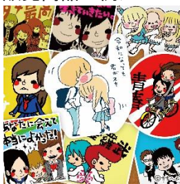
ステッカー 500 円(税込)