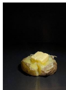
じゃがバター 700円(税込)

また北海道の牧場のこだわりの生乳を使用した濃厚なソフトクリームとシェイクも提供します。