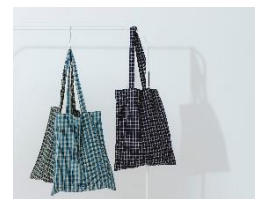
ノベルティ商品：ルームウェア(左)、トートバッグ(右)