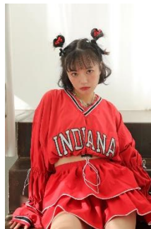
REMADE by SPINNS