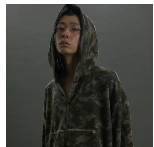
Layered Crush Hoodie 23,100 円(税込)