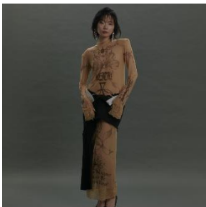
Armed Second Skin Dress #2 14,300 円(税込)

唯一無二の世界観で注目を集める neith.(ネイス)が 2F CONTAINER を単独ジャック。「適合することを優先しない、自分らしく生きることこだわるファッションブランド」をコンセプトに掲げ、常に新しい価値観を発信。今回の POP UP SHOP では、新たにリメイクアイテムにチャレンジし、ますますエキサイティングなコレクションをお届けします。