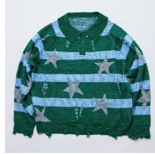
星柄ボーダーニット 16,500円(税込) ブルー/ピンク/グリーン