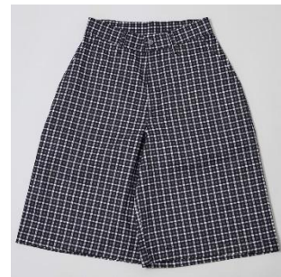
チェックハーフパンツ 21,450円(税込) ブラウン/ブルー/ブラック