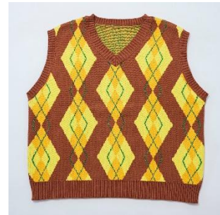
アーガイル柄ニットベスト 13,200円(税込) ピンク/グレー/ブラウン