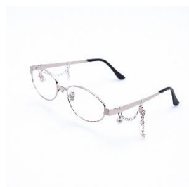
オーバル(シルバー)チャーム 5,980 円