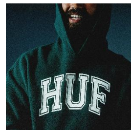
CRACKED ARCH REVERSE HOODIE 22,000 円