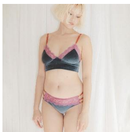
Velour Lace Bustier Bralette 14,300 円 Velour Lace Side-Strap Shorts 7,480 円