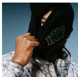
VOGEL BALACLAVA 7,480 円