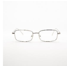
スクエア(シルバー) 3,280 円