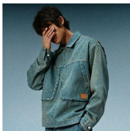
DRESDEN DENIM WORK JACKET 29,975 円