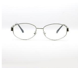
オーバル(シルバー) 3,830 円