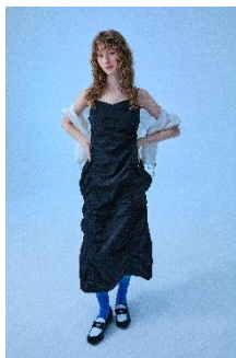
WOMEN'S NYLON BUSTIR DRESS 14,690 円

■ GISELLE がブランドアンバサダーを務める WackyWiLLy サマーシーズン初のポップアップストア開催 あたたかな光と風に満ちるサマーシーズンにぴったりの軽やかなテクスチャーと、自然に流れるロマンチックなシルエットのレイヤードルックをお楽しみください。