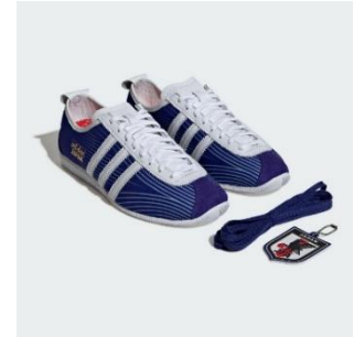
ジャパン JFA ホーム 19,800 円