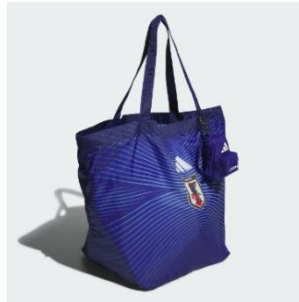
サッカー日本代表 2026 ホーム パッカブルバッグ 3,850 円