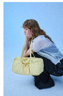
WOMEN'S STRING SHOULDER BAG 10,650 円/ WOMEN'S NYLON SHORT SLEEVE WINDBREAKER 16,040 円