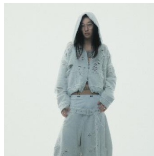
Destroyed Crush Hoodie 25,300 円