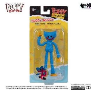
Poppy Playtime ベンダブルフィギュア 4.5 インチ シリーズ 1 ハギーワギー 3,300 円