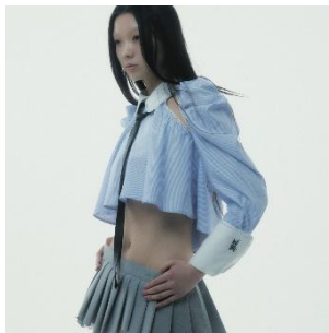
Cleric Flare Shirt 16,500 円