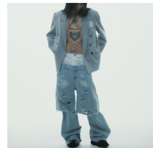
Destroyed Denim and Legcover 29,700 円