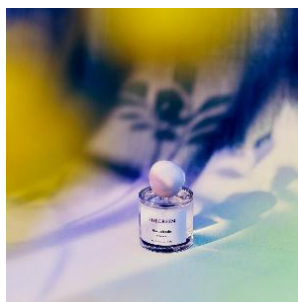
herbalcode 14,000 円

日本発のリチュアルフレグランスブランド SHEEGREEN の POP UP を開催。自然の生命力を表現した全 20 種のフレグランスをフルラインナップで展開し、それぞれの香りが持つストーリーや世界観を体験できる特別な空間をご用意します。ご購入の先着 88 名様にはお好きな香りのミニボトルをプレゼントします。