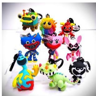
Poppy Playtime ブラインドミニ キーホルダー vol.2 1,650 円