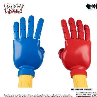
Poppy Playtime グラブパック (ブルー/レッド) 各 5,500 円