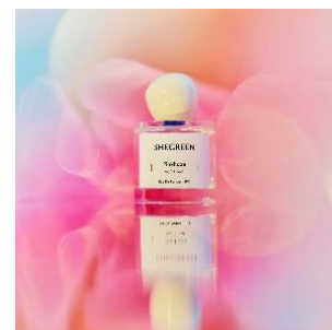
pinkhaze 14,000 円