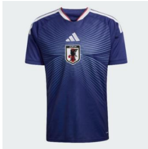
サッカー日本代表 2026 ホームレプリカ ユニフォーム 13,200 円